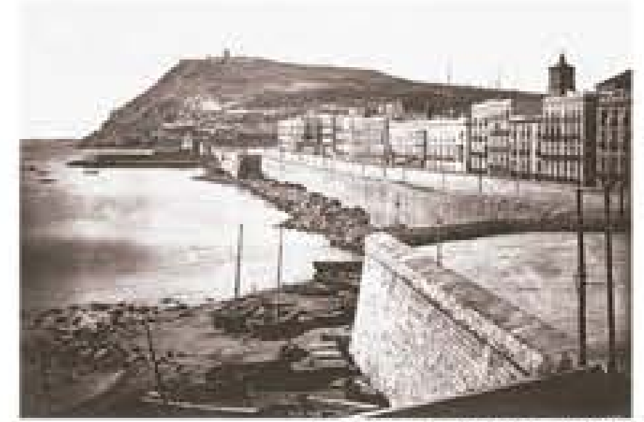
La Muralla del Mar (1870)