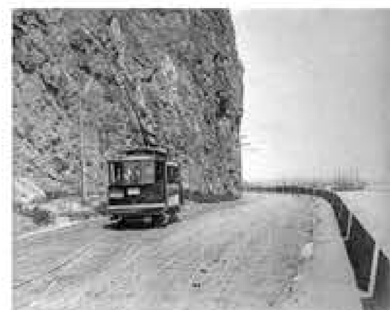
Tramvia 48 connexió per Morrot (1960)