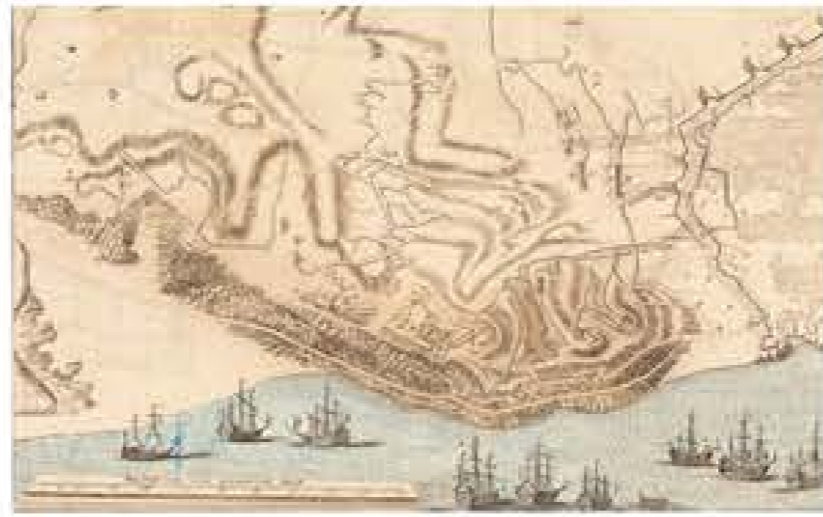
Mapa de Barcelona (1706)

A la cartografia històrica de l'any 1926 ja apareixen algunes de les traces importants que avui dia connecten la ciutat de Barcelona amb la Zona Franca. El Passeig de la Zona Franca i la via del Morrot s'acaben creuant al punt on avui dia trobem un nus viari de la Porta 29 del Port, l'espai de projecte.