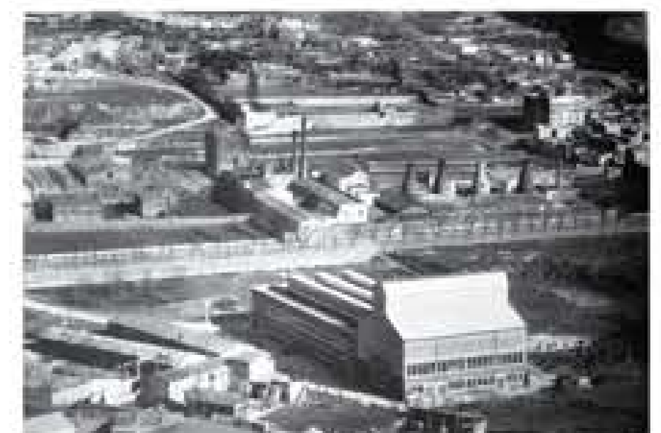
Passeig de la Zona Franca (1960)