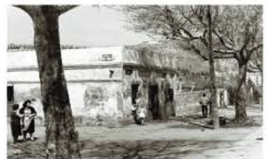
Carrer Peris - actual C/ Santa Eulàlia