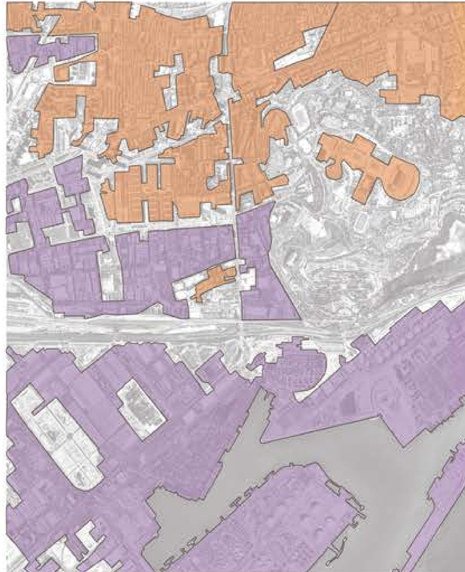
Teixit urbà (orange) / Teixit industrial (purple)