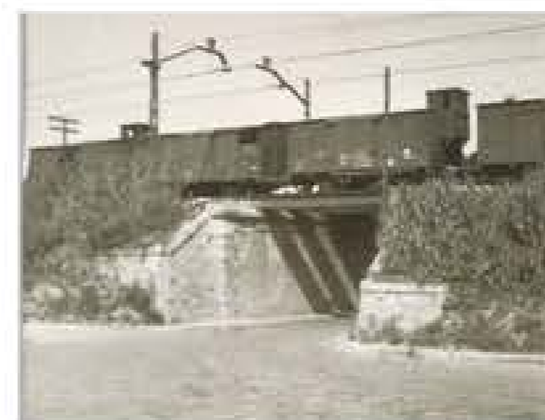
Pas sota les vies de tren Carretera Nostra Sra. del Port (1969)