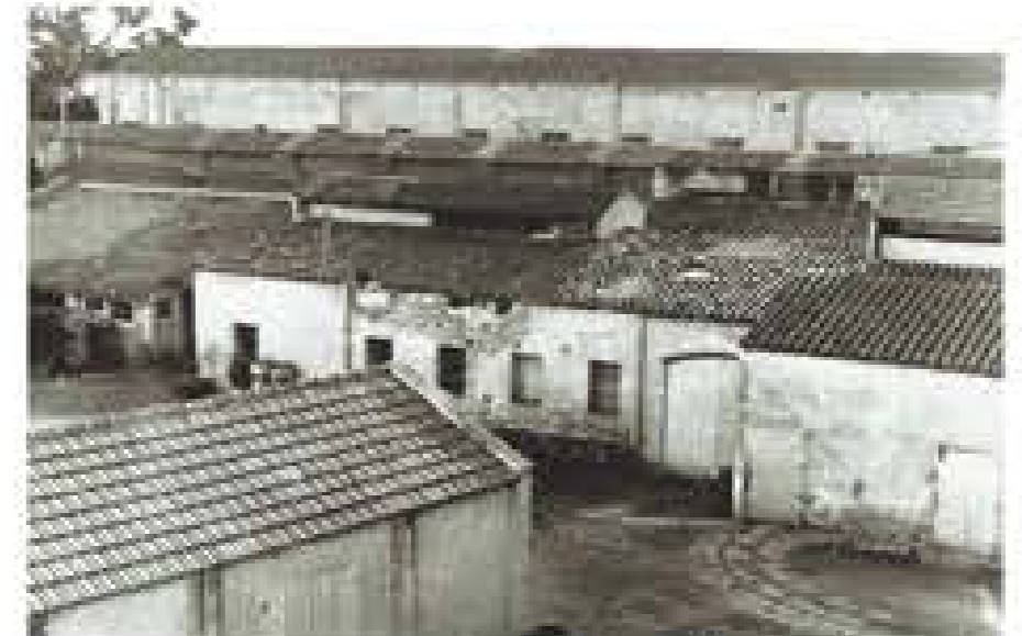
Cases de treballadors a la Marina del Prat Vermell (S.XX)