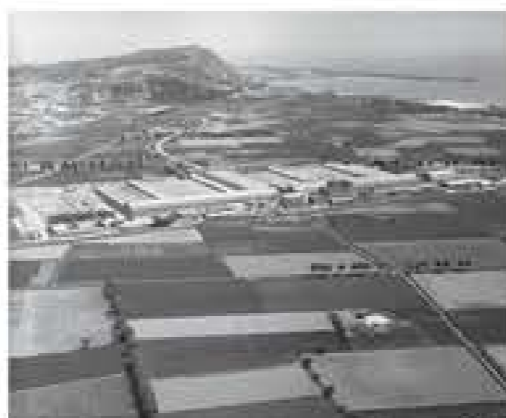
Fàbrica Seat i Montjuïc al fons (1961)