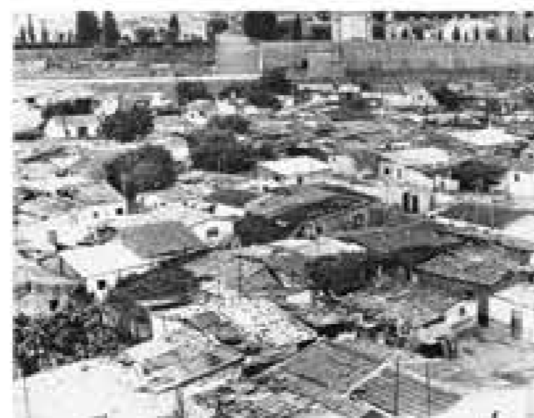
Barraques al peu de Montjuïc (1950)