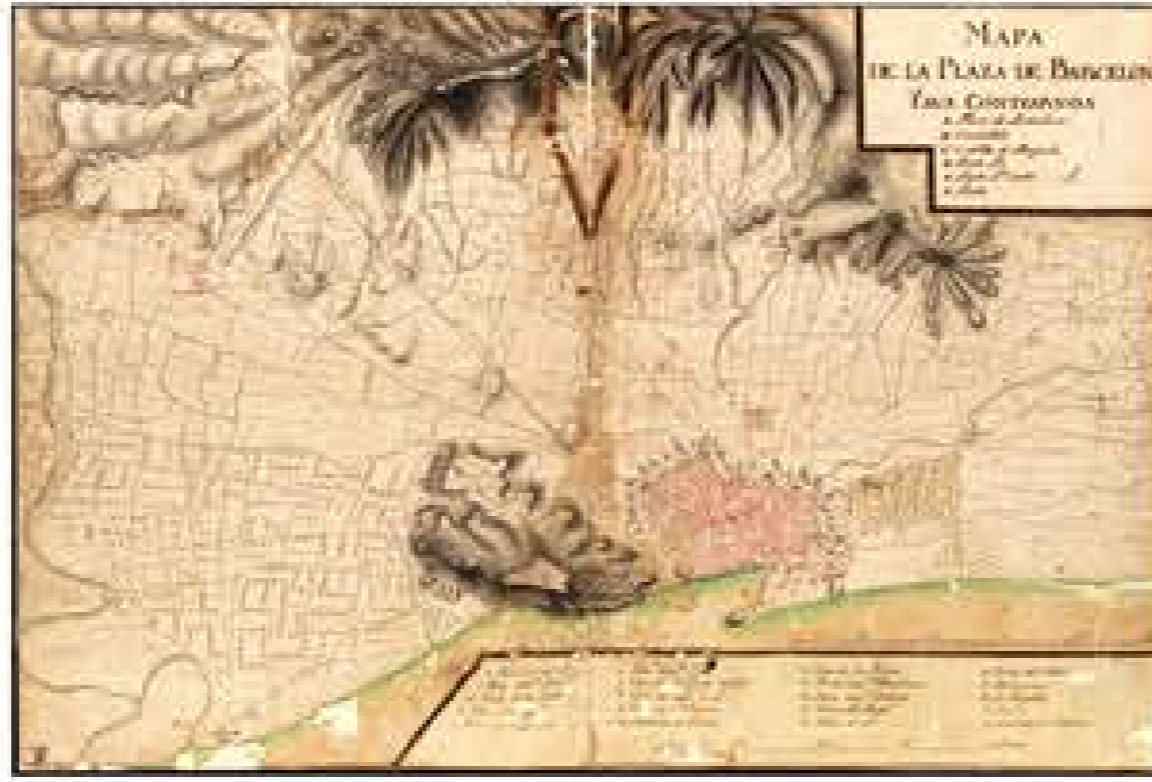
Barcelona i els seus contorns (S. XVIII)