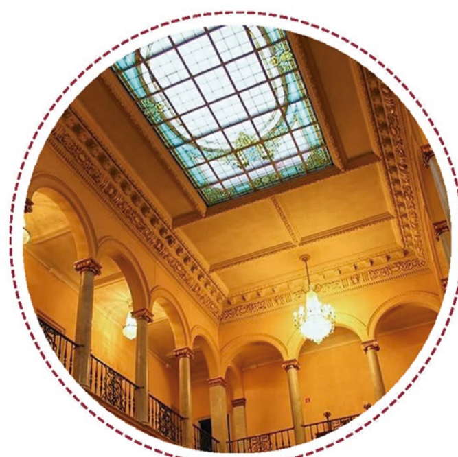
CLARABOIA DEL PALAU