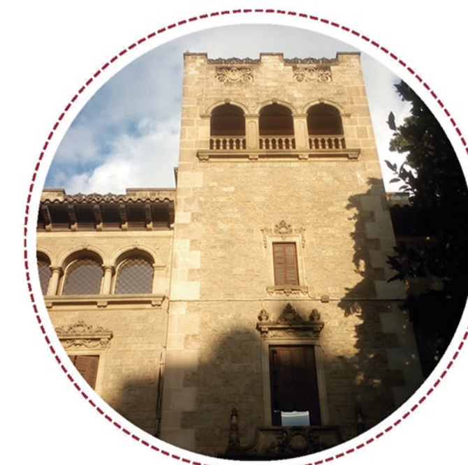
TORRE DEL PALAU