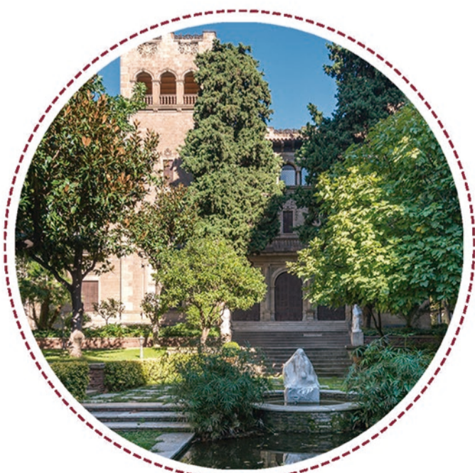
JARDINS DEL MARQUÈS D'ALELLA