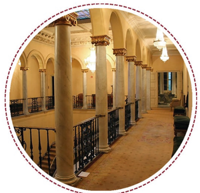
PLANTA PRIMERA DEL PALAU