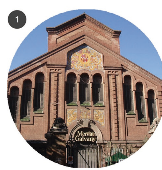
MERCAT DE GALVANY