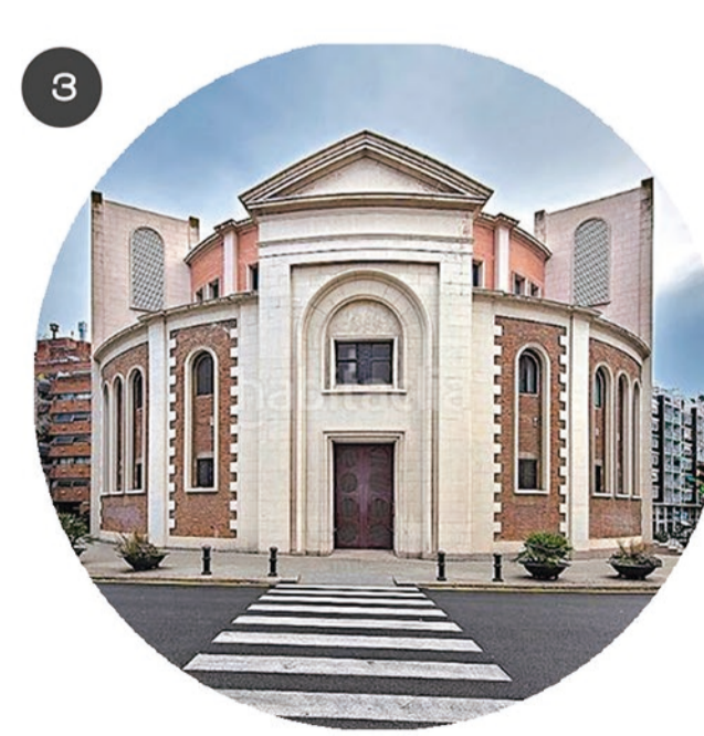
PARROQUIA DE ST GREGORI TAUMATURG