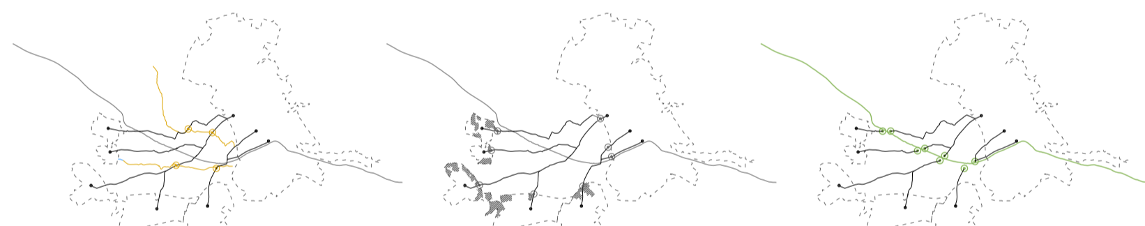
sèquia programa productiu límit urbà programa urbà riu programa lúdic