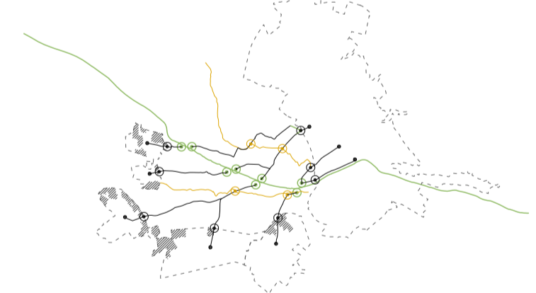
la reprogramació es farà en funció de l'element estructurant del territori amb què es creuen els parcs lineals