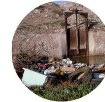
arado de los equinos