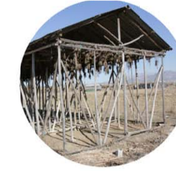
asecadero en seco

Ni el azúcar ni el tabaco eran cosas de la vega. Granada siempre ha comido de lo que crecía en su huerta y a eso tiene que volver. Eso ha sido siempre así, desde antes de los moros - Camperón anónim -