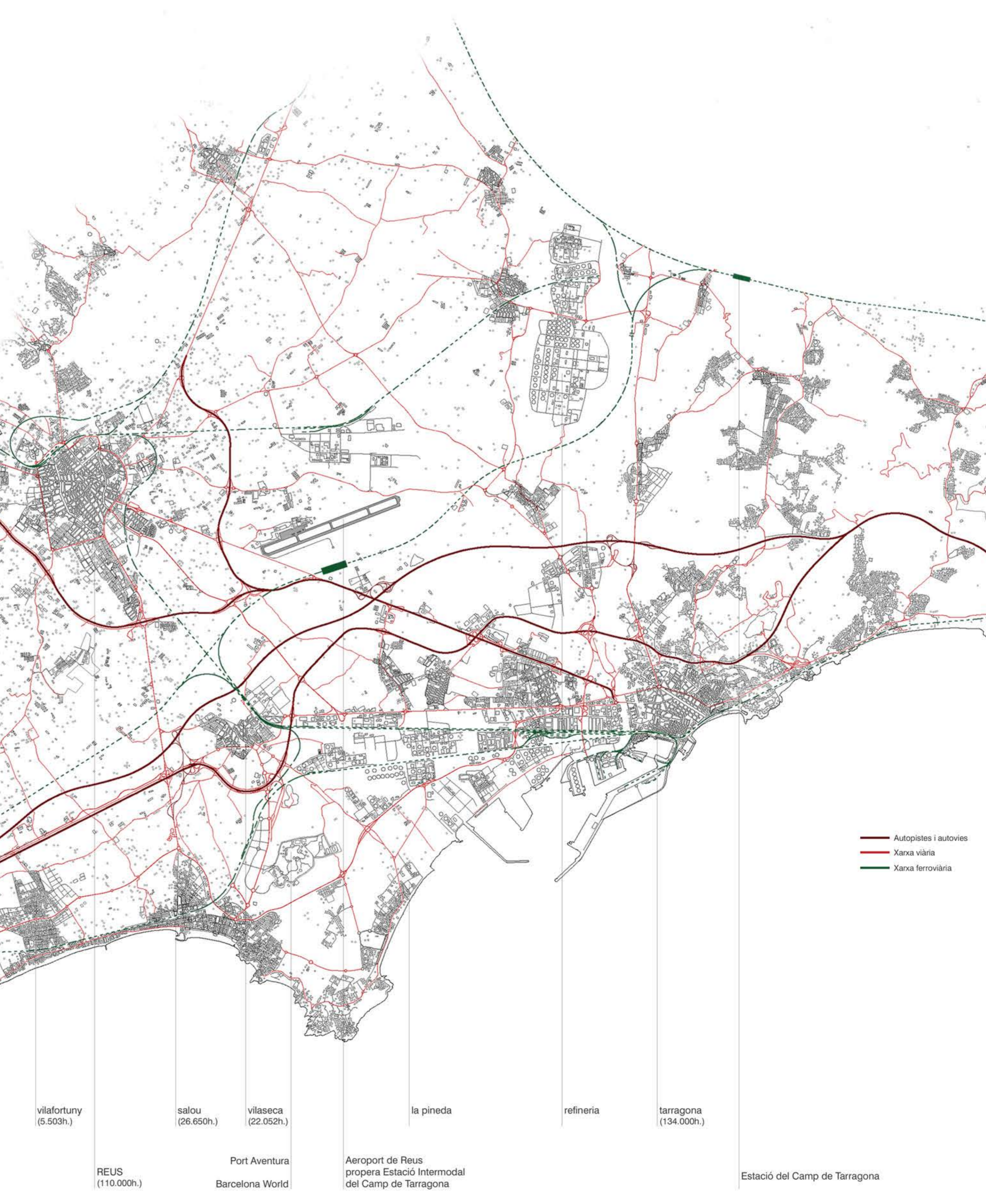
Camp de Tarragona e 1:50.000