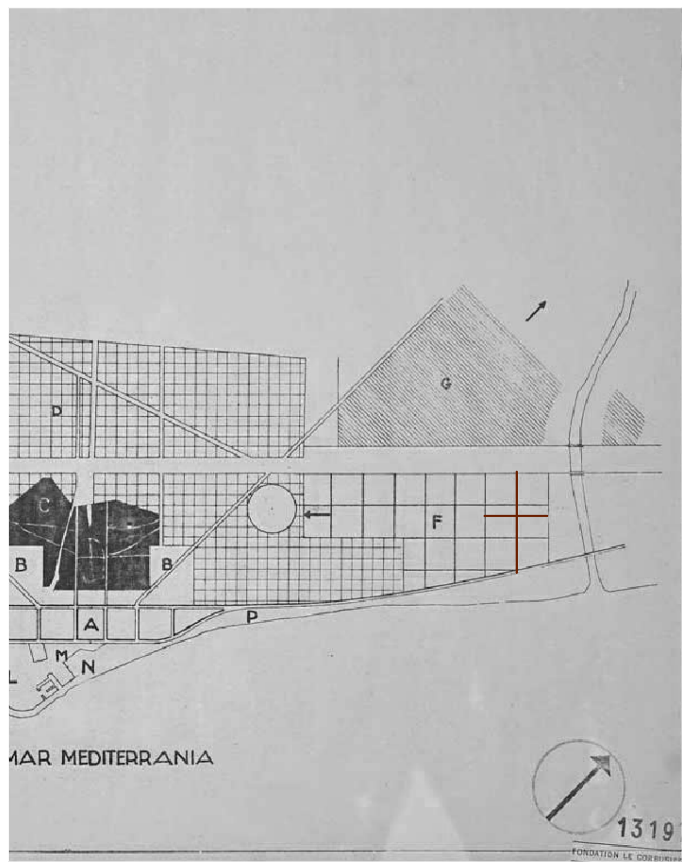
PLA MACIÀ. 1932. Autor: GATCPAC Superilles a l'àmbit d'estudi. Trama de gairebé 400x400m corresponent a tres illes de l'Eixample Cerdà.