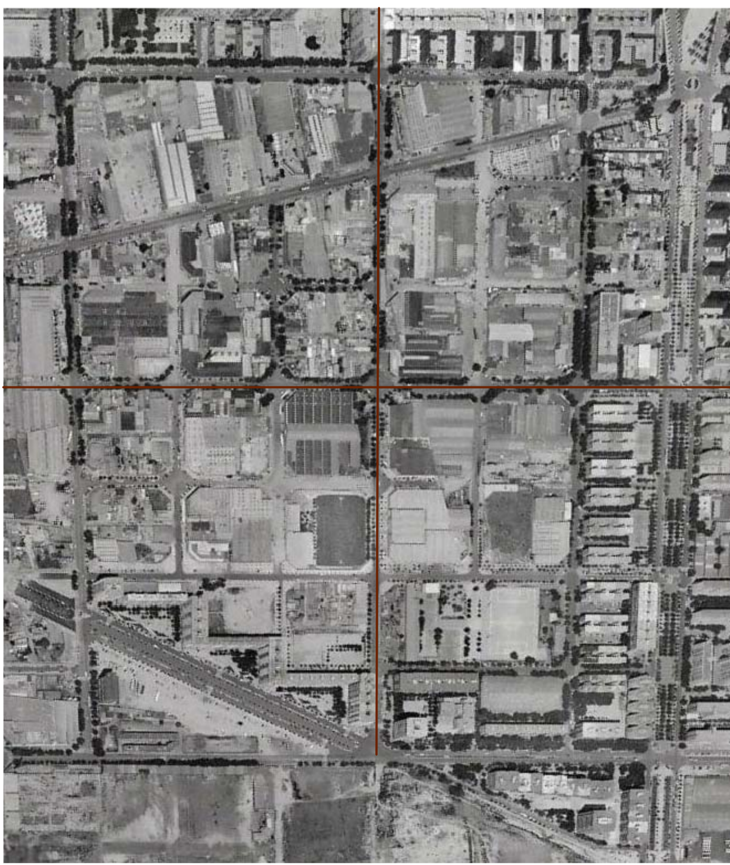
FOTOPLA DE BARCELONA Any 1994. Carrers interiors de les superilles, sense pavimentar o tallats la majoria