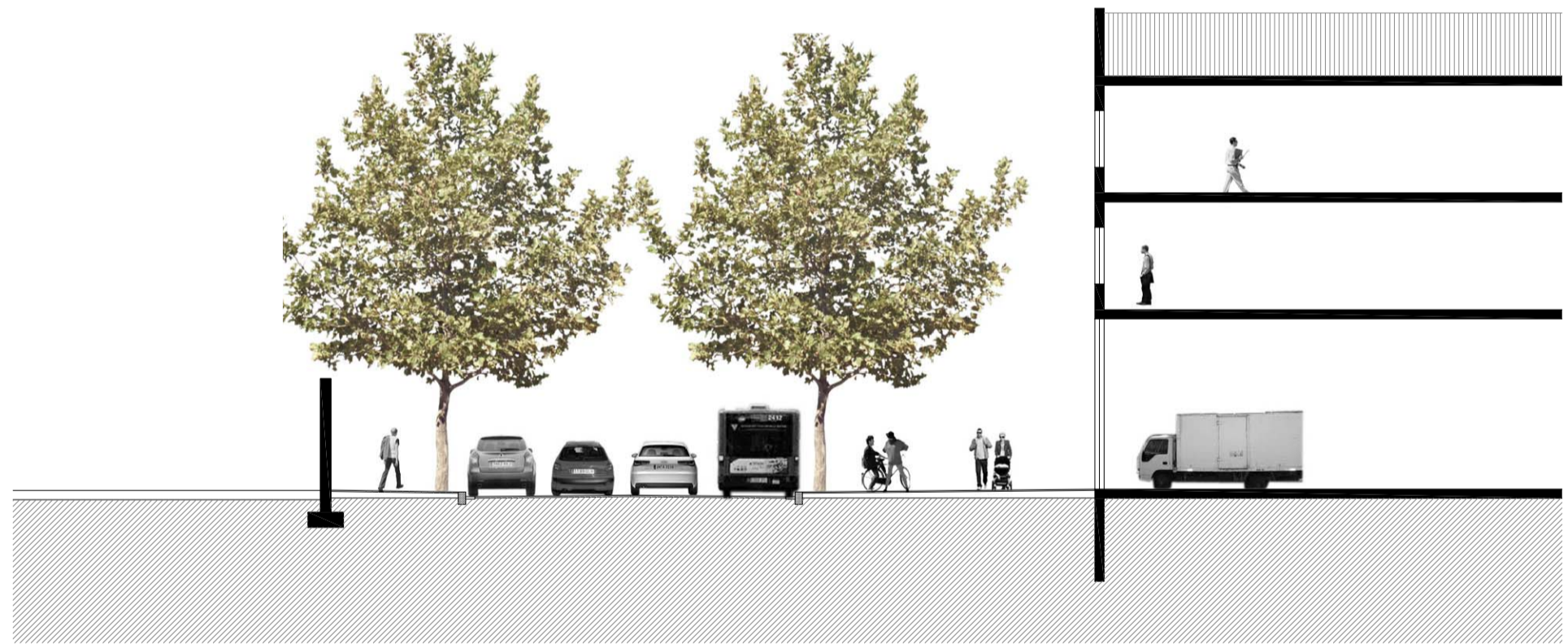
SECCIÓ D-D' 1/200