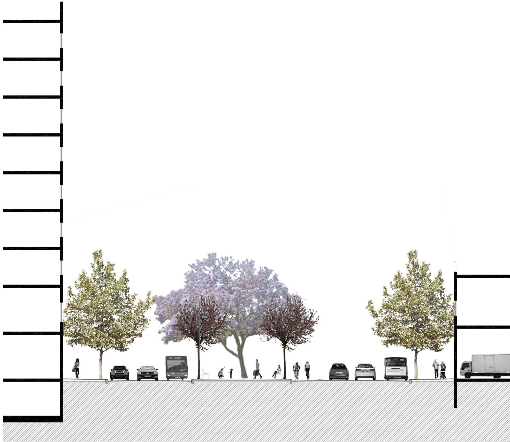
SECCIÓ D-D' 1/200