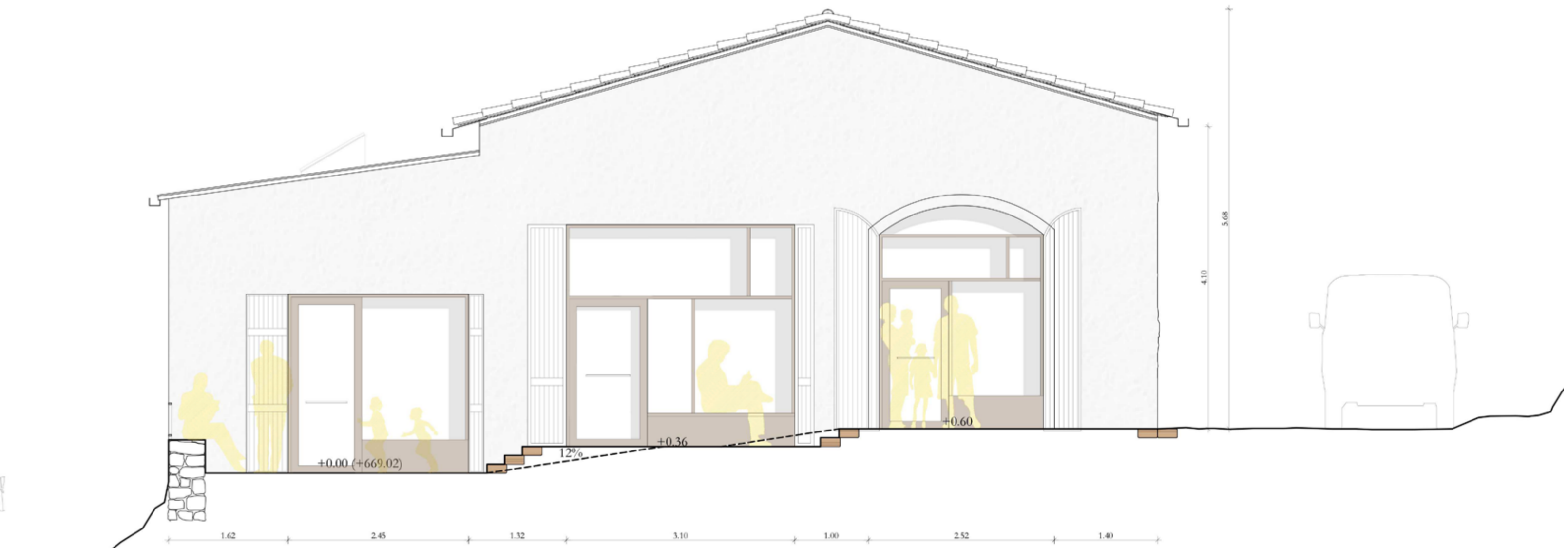
ALÇAT DE PONENT e1:50