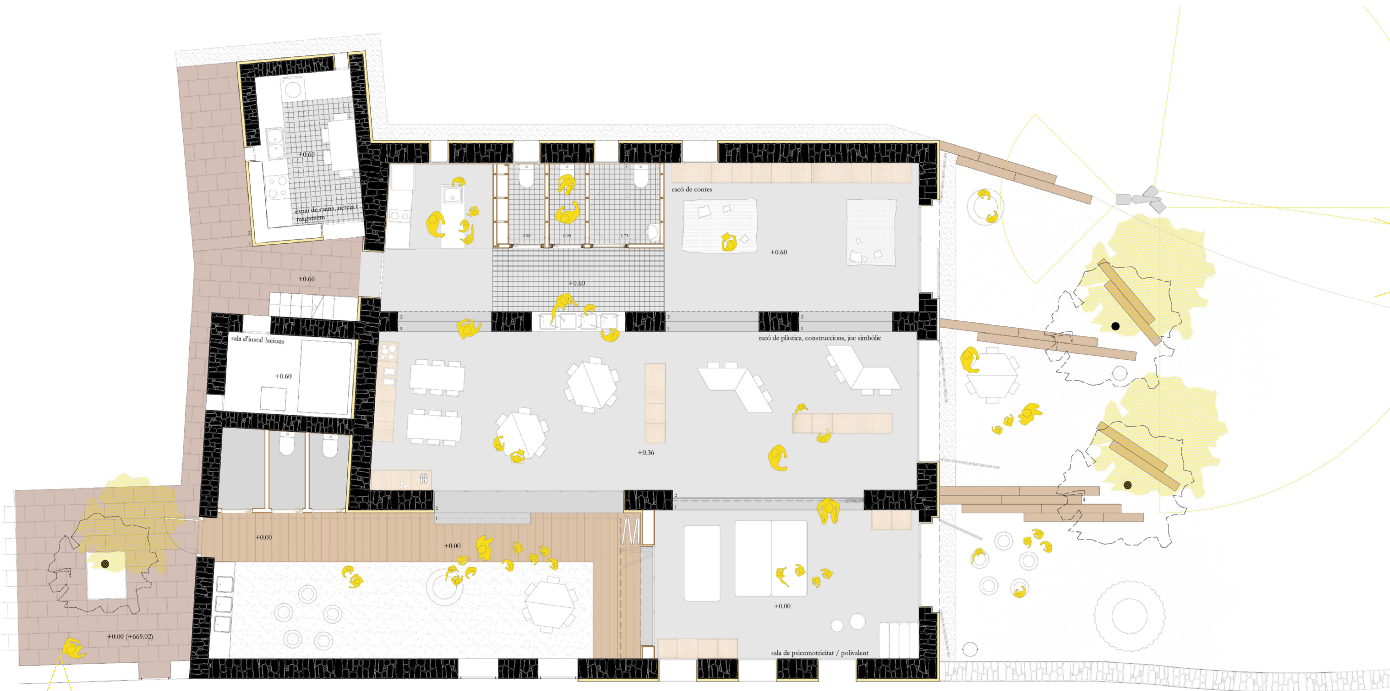
PLANTA PROPOSTA D'INTERVENCIÓ e1:50