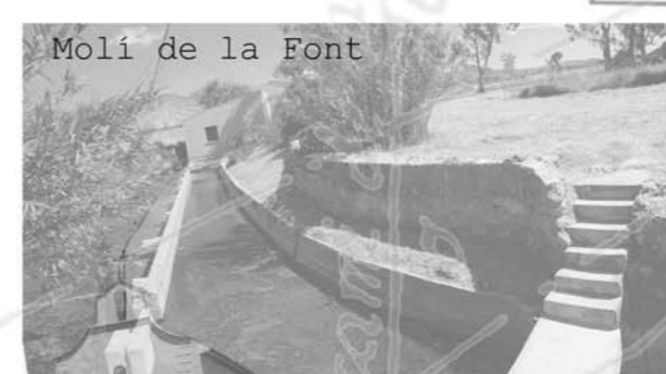
Molí de la Font

Als anys 60 ens barjovem a l'ajuntament del molí de la Font