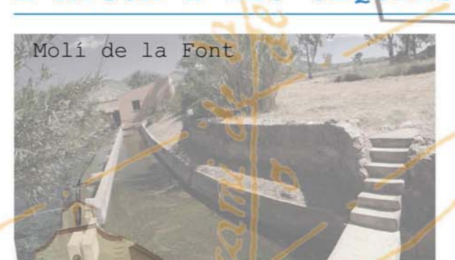
Molí de la Font