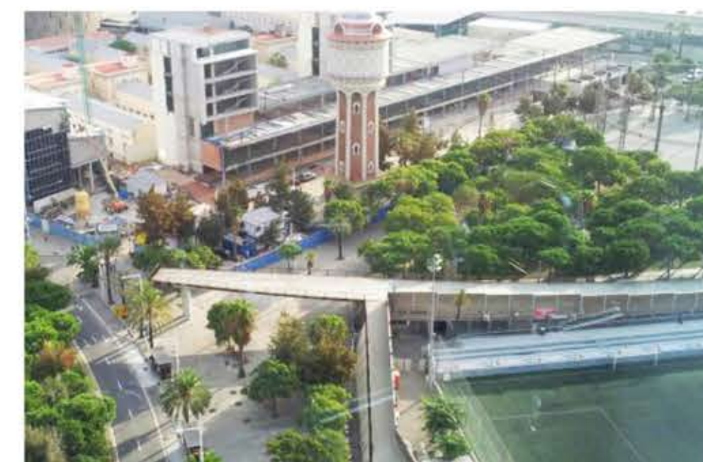
Pont del Pla Director de la Ciutadella, 2001.