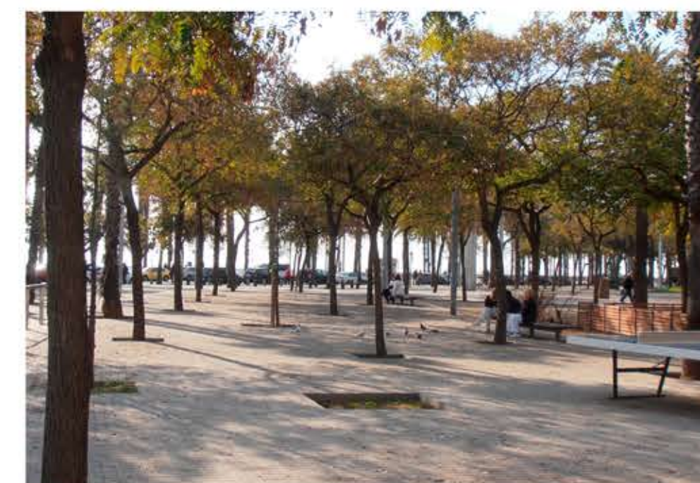
Parc de la Barceloneta, 1996.