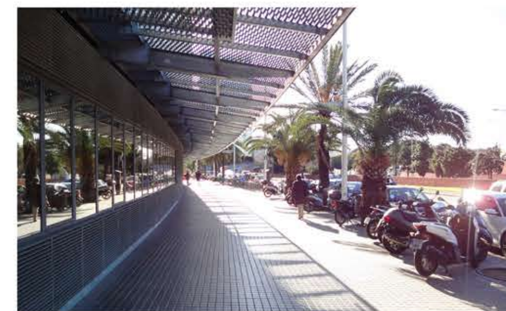
Façana Universitat Pompeu Fabra, C/Doctor Aiguader, 1991.