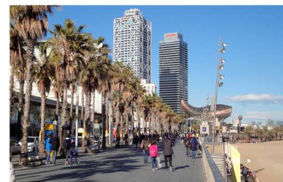
Façana edifici consultes externes, 1992.

L'Hospital del Mar gaudeix de una situació única , a primera línia de mar, donant front al Parc de la Barceloneta principi i fi del parc lineal que travessarà la ciutat de Barcelona. En un barri contrastat per els que hi viuen i els turistes, un entorn que canvia segons les estacions de l'any, amb activitat i serveis, amb festes i tradicions.