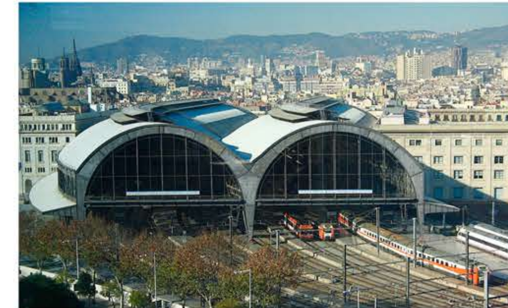
Estació de França, 1929.