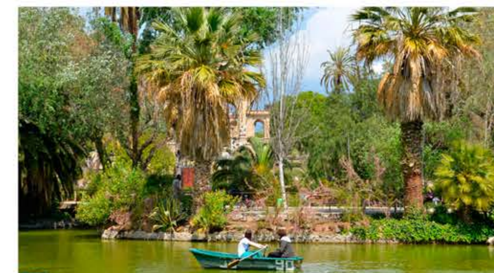
Parc de la Ciutadella, 1888.