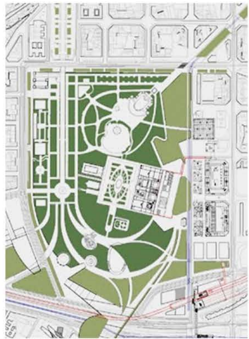
Pla Director de la Ciutadella, 2001, Batlle i Roig.

Els guanyadors Batlle i Roig arquitectes, proposaven la remodelació de les 27Ha del parc quan s'hagi traslladat el zoo i s'obri a les dependències de l'Universitat Pompeu Fabra. El projecte preveu la connexió d'aquest parc amb el parc de la Barceloneta passant per sobre el traçat ferroviari. Finalment el Pla Director, no es va dur a terme a causa de la impossibilitat de traslladar el zoològic. Es va construir la primera fase del pont al Parc de la Barceloneta, una infraestructura de formigó d'arquitectura brutalista que no funciona com a tal i serveix com a mirador.