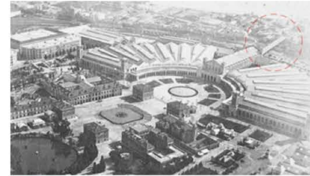
Vista aèria Exposició Universal 1888