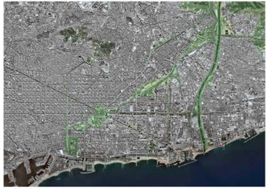
Parc lineal de la Segrera, Barcelona. West 8, RCR i Adayjover.

El 2001 l'Ajuntament de Barcelona inicia un concurs per remodelar el Parc de la Ciutadella i el seu entorn, anomenat Pla director de la Ciutadella .