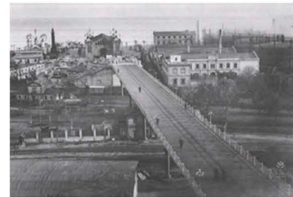
Atravesant per sobre les vies del ferrocarril, Exposició Universal 1888