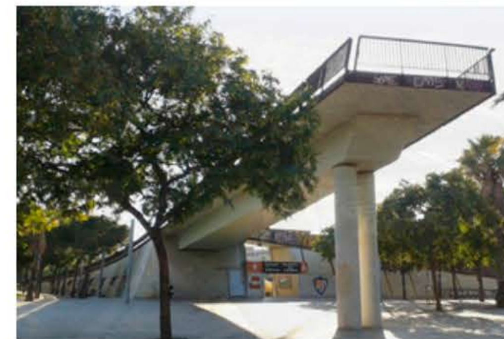
Pont existent, Pla Director 1994.