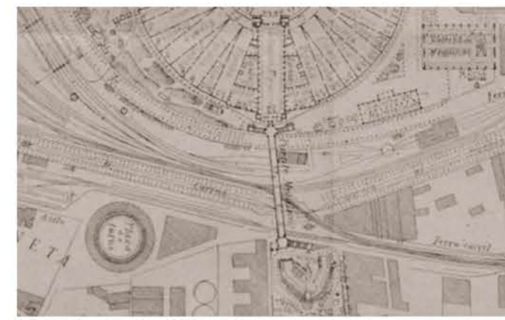
Pont secció marítima Exposició Universal 1888