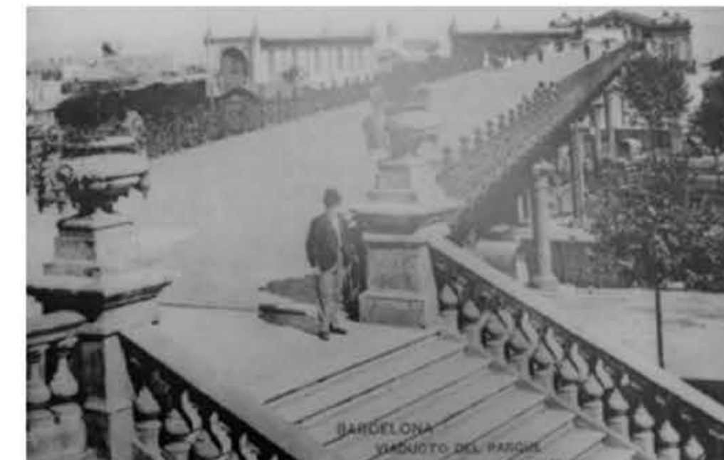
Pont Exposició Universal 1888