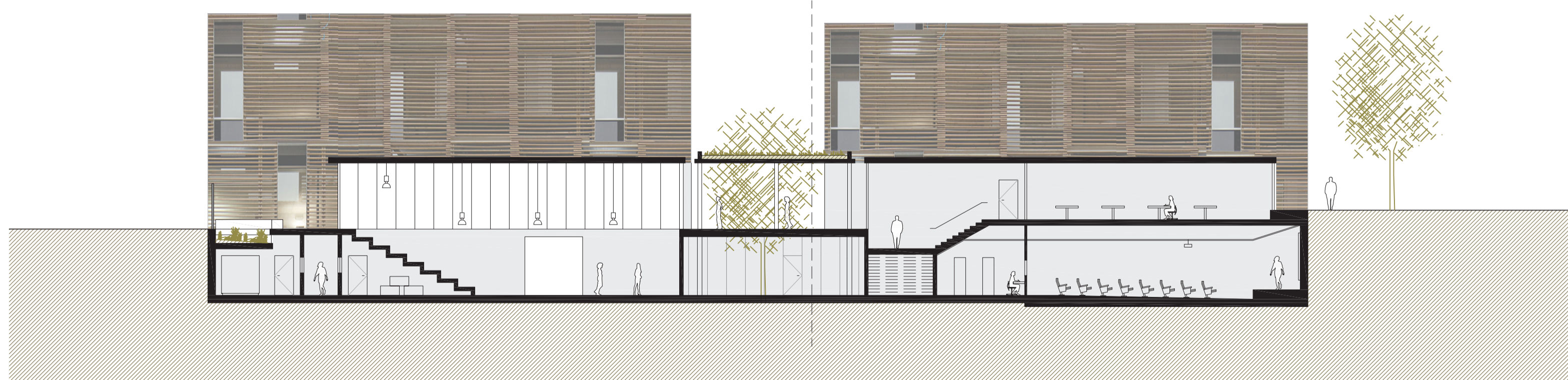
S3_SECCIÓ TRANSVERSAL (A TRAVÉS D'ESPAYS COMUNS)