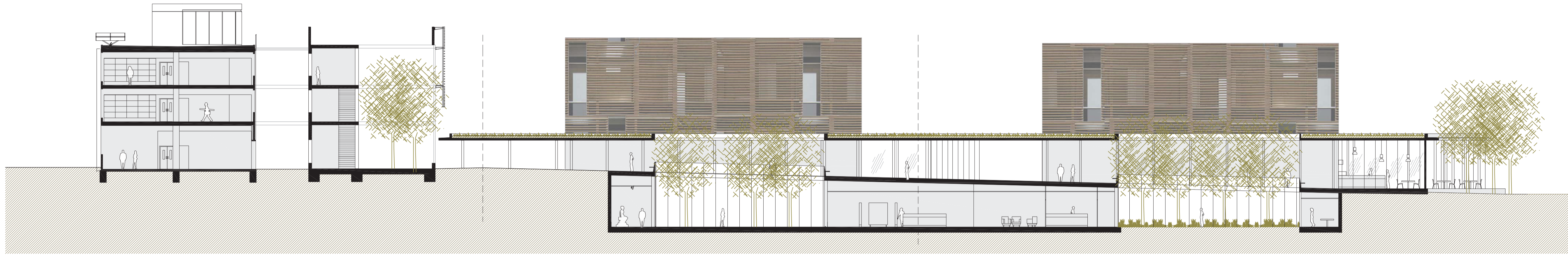
S1_SECCIÓ LONGITUDINAL (A TRAVÉS DELS PATIS)