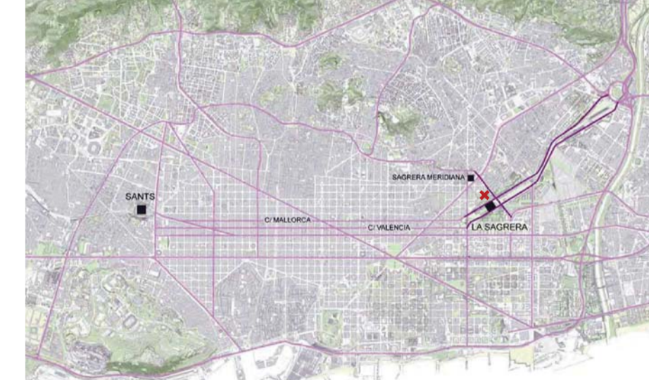
SISTEMA VIARI [XARXA DE VIES PRINCIPALS] El nou campus es situa fent façana al carrer de la Sagrera, que conjuntament amb la Meridiana, permeten una entrada i sortida ràpida de vehicles rodats, ja siguin públics o privats. Així, l'escola disposa d'una bona connexió a través de vies principals.