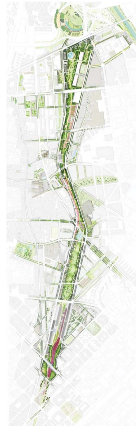
Projecte d'urbanització del Parc Lineal Sant Andreu - La Sagrera Alday Jover Arquitectos / RCR Arquitectes / West 8