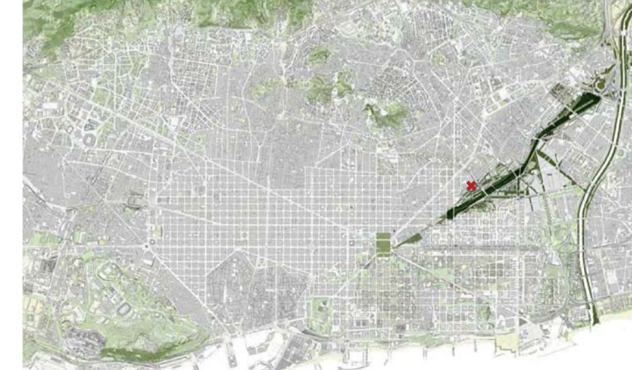
SISTEMA D'ESPAYS VERDS [XARXA DE PARCS] Situat davant del gran Parc Lineal Sant Andreu-La Sagrera, el projecte d'urbanització i creació d'espais públics del campus complementa i es relaciona amb el sistema urbà d'espais verds de la ciutat. A part, el parc es convertirà en un eix primari de carril bici fins al campus.