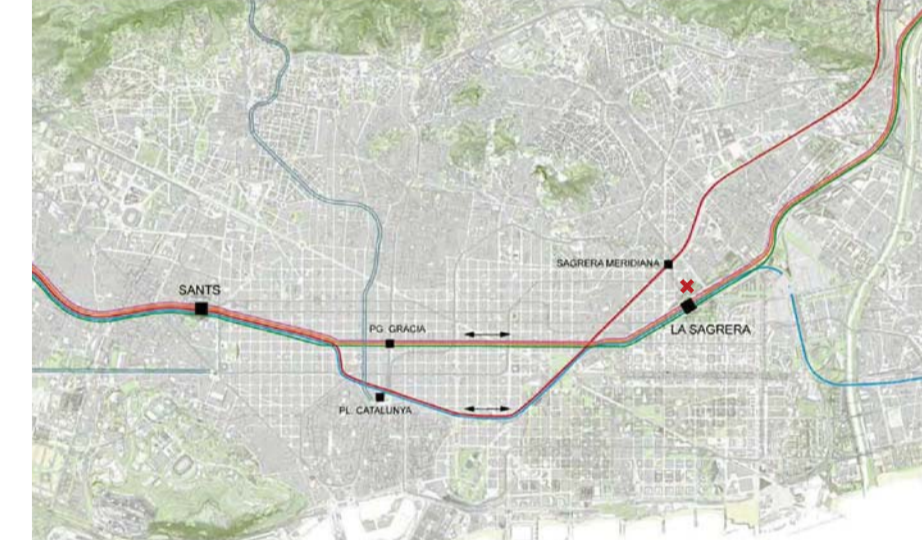
TRANSPORT PÚBLIC [XARXA DE TRENIS] L'estació de ferrocarrils de La Sagrera actua com a estació intermodal entre els transports urbans i els de mitja i llarga distància, com passa amb el cas d'estació de Santis, propicia que el campus pugui esdevenir un equipament d'àmbit metropolità.