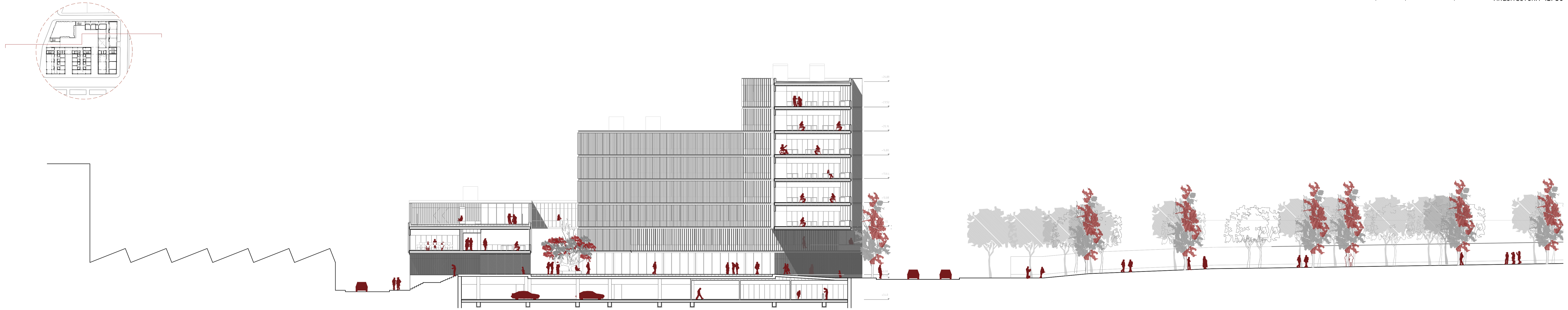
Secció 1 e. 1/200