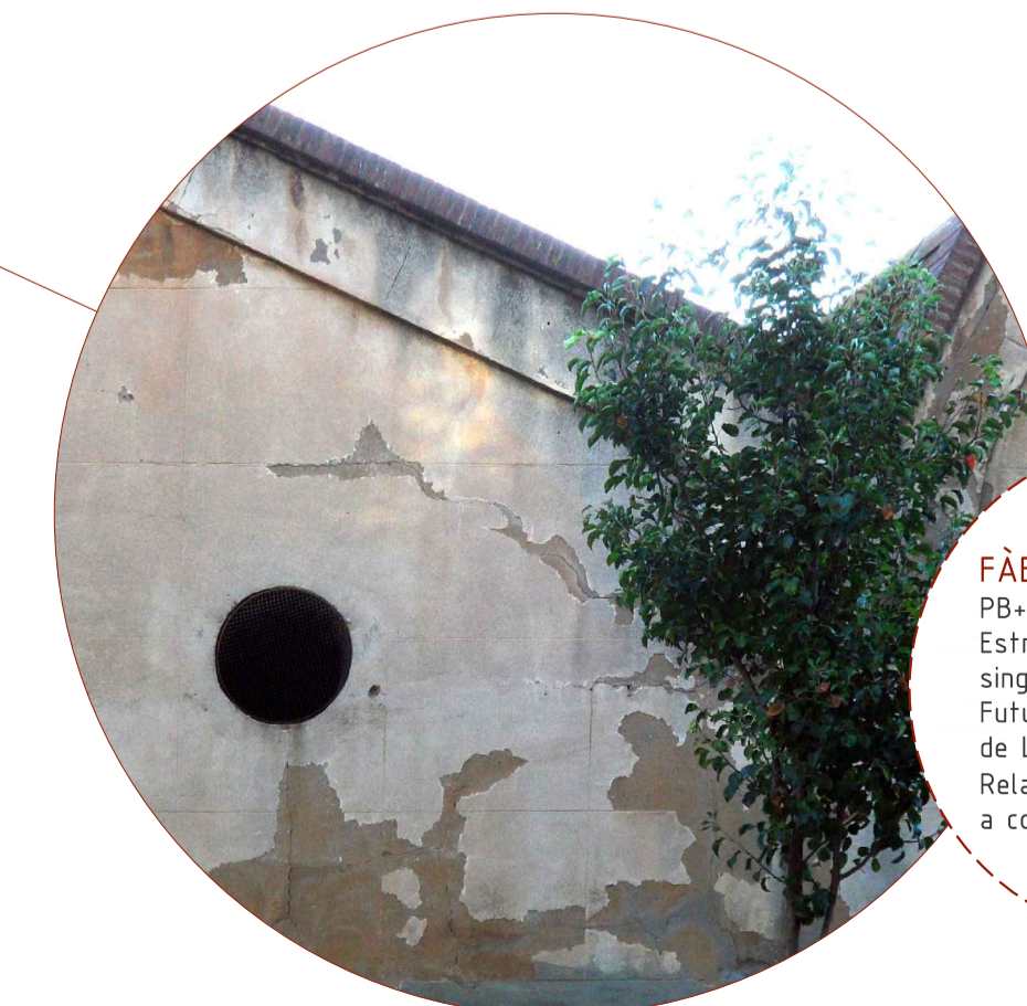
FÀBRICA DE VIDRE PB-2,+4 Estructura interior i façana singular Futura biblioteca de districte de Les Corts Relació edificatòria i alçades a considerar