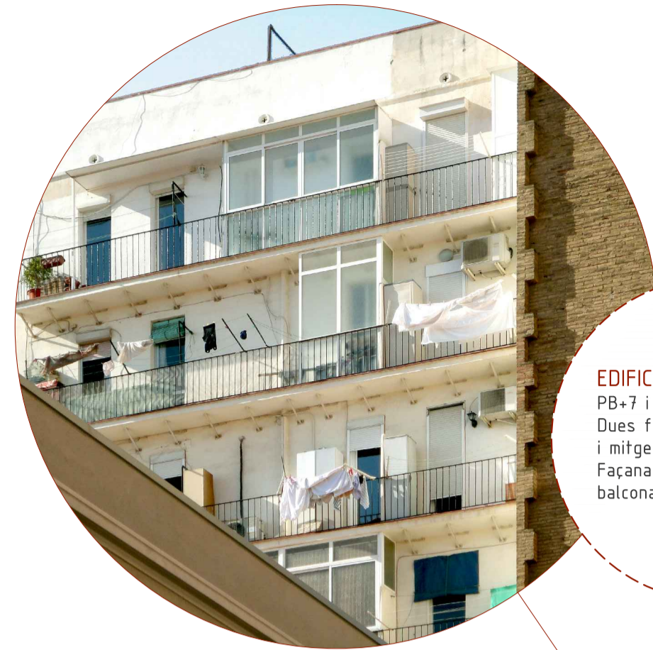
EDIFICI RESIDENCIAL VÉI PB+7 i PB-1 Dues façanes interiors d'illa i mitgeres Façana amb obertures i balconades a rehabilitar