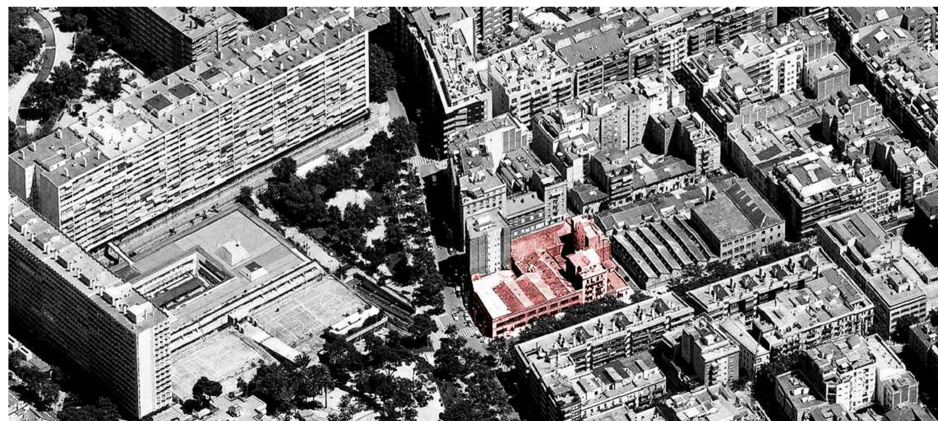
Vista d'ocell perfil SO

La disposició dels habitatges de dues alçades del passatge entre els carrers de Novell i d' Evarist Arnús acaba de compondre la complexitat d'un solar exigint en quant a la conciliació de diferents hàbits i realitats urbanes, expectatives de relació amb la ciutat i els espais públics propers, i la col·matió del discurs volumètric i edificatori de l'eix de Comtes de Bell-Lloc a partir del seu inici a l'estació de Sants.