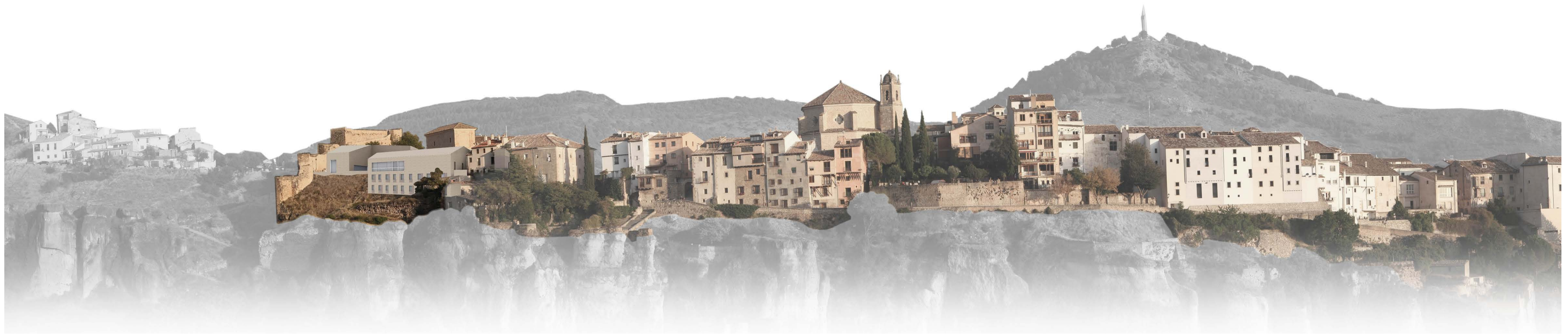
alçat nord de la ciutat de cuenca amb el projecte integrat e 1:150