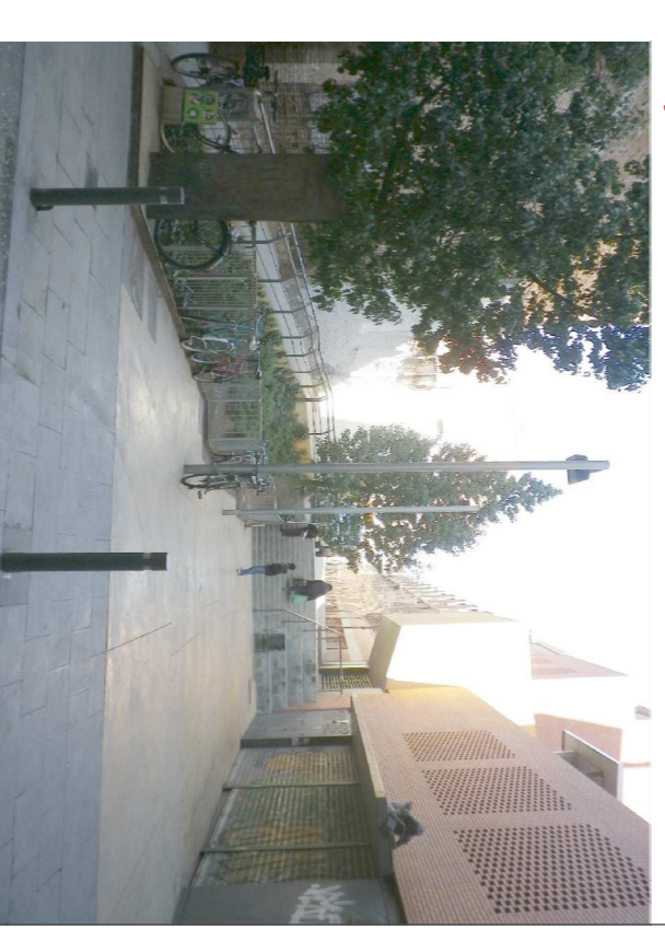
PLAÇA ANNA FRANK