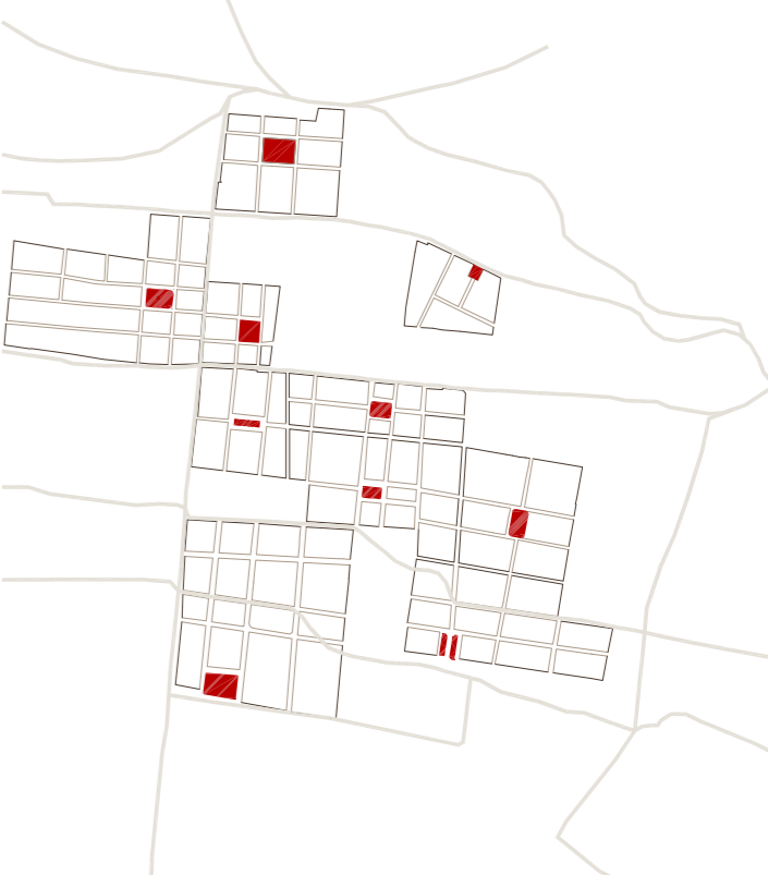
NAIXEMENT DEL BARRI