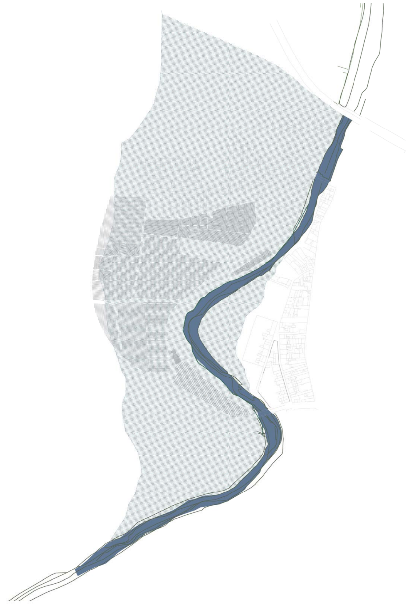
Riu Daró, ZONES INUNDABLES en escorrenties notables de riu ---entendre l'àmbit de projecte com a SUPORT NATURAL en moviment