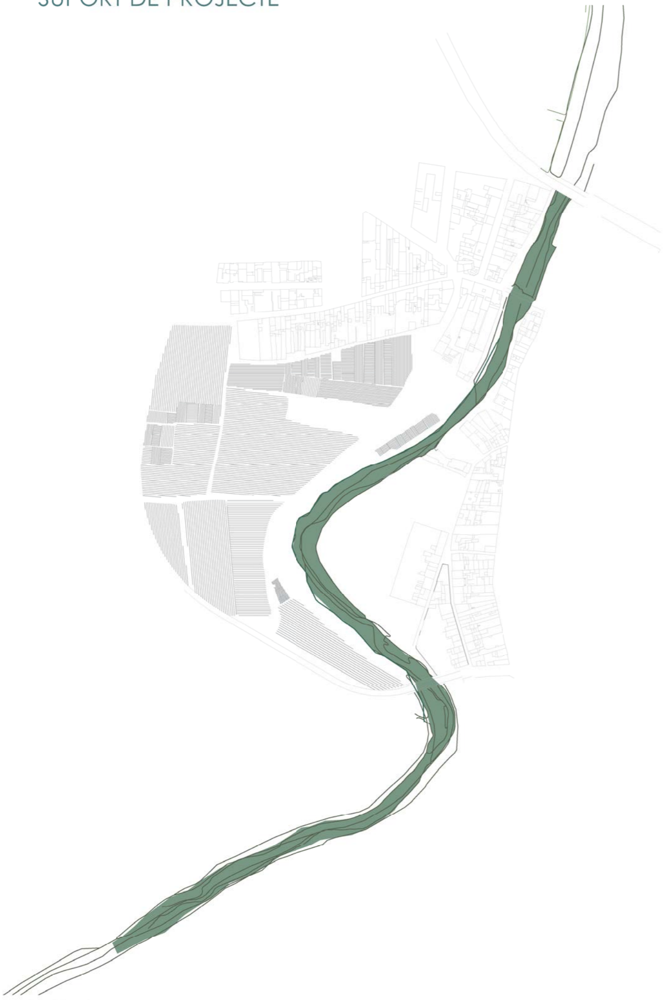
Riu Daró, SEC la majoria part de l'any ---permet ESTIRAR EL CAMÍ EXISTENT que comunica el projecte amb els camps