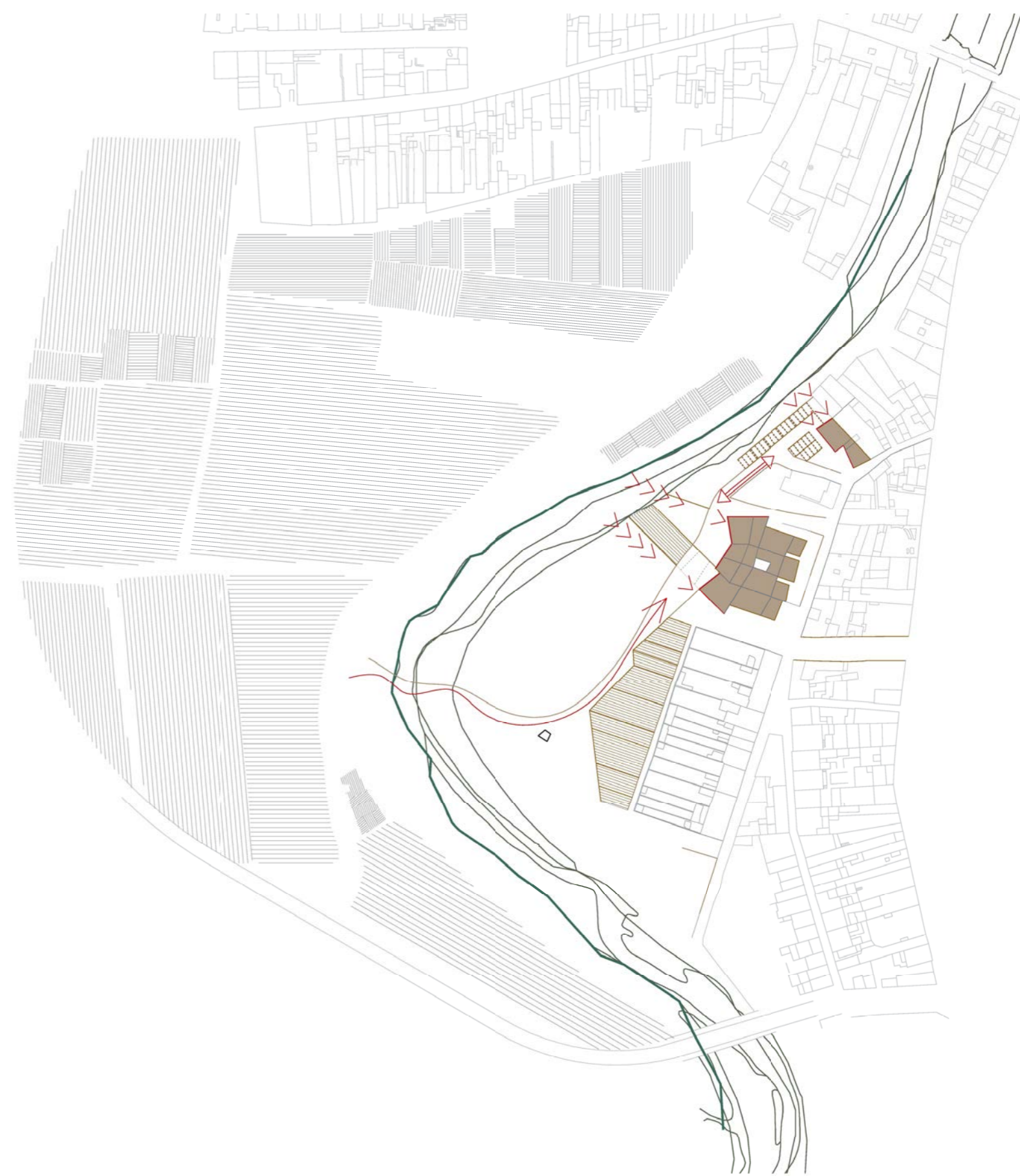
Projecte: cercar estratègies SENSIBLES al seu entorn sense renunciar a EDIFICACIONS, tot i separant-se lleugerament del riu i creant porositats entre riu-carrer