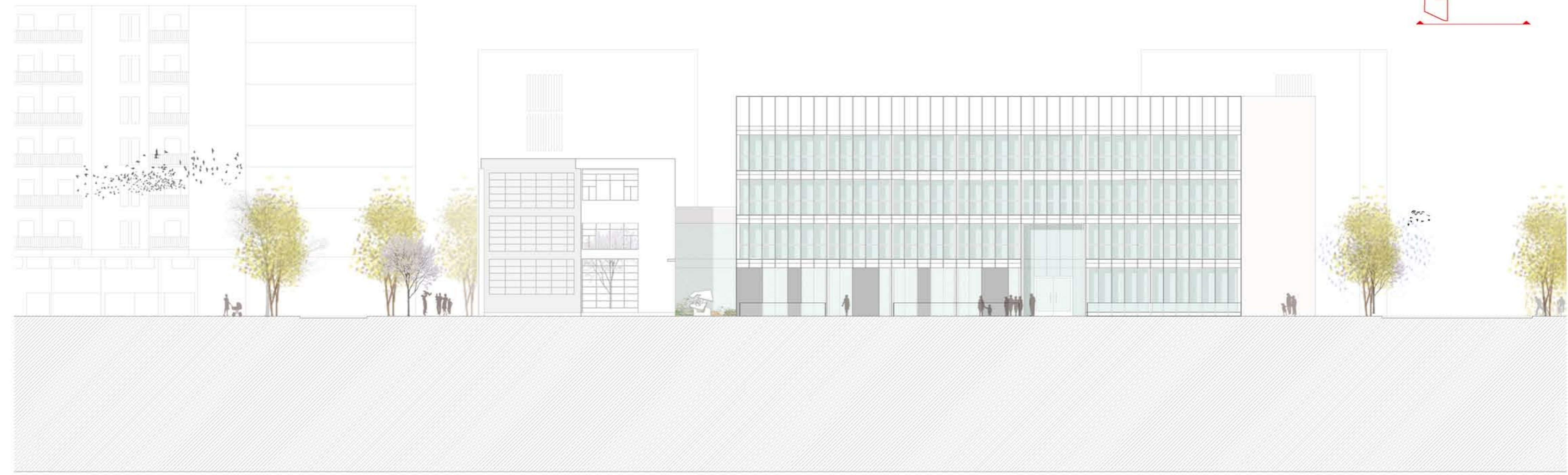
Alzado sur-oeste E/ 1:200