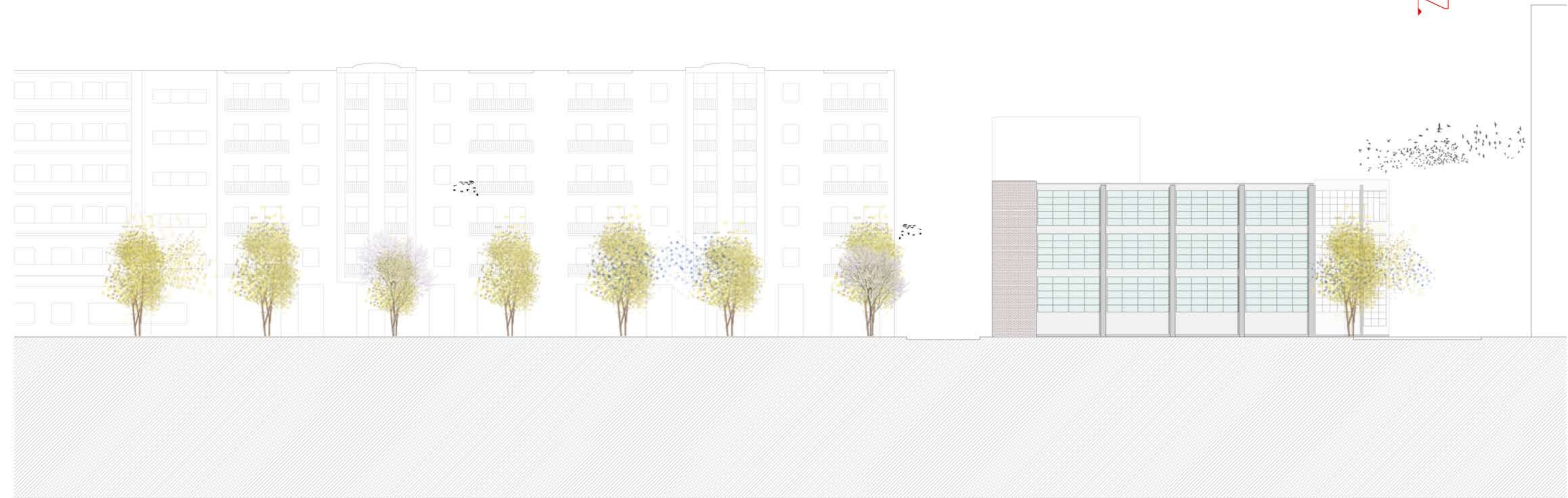
Alzado Noroeste E/ 1:200