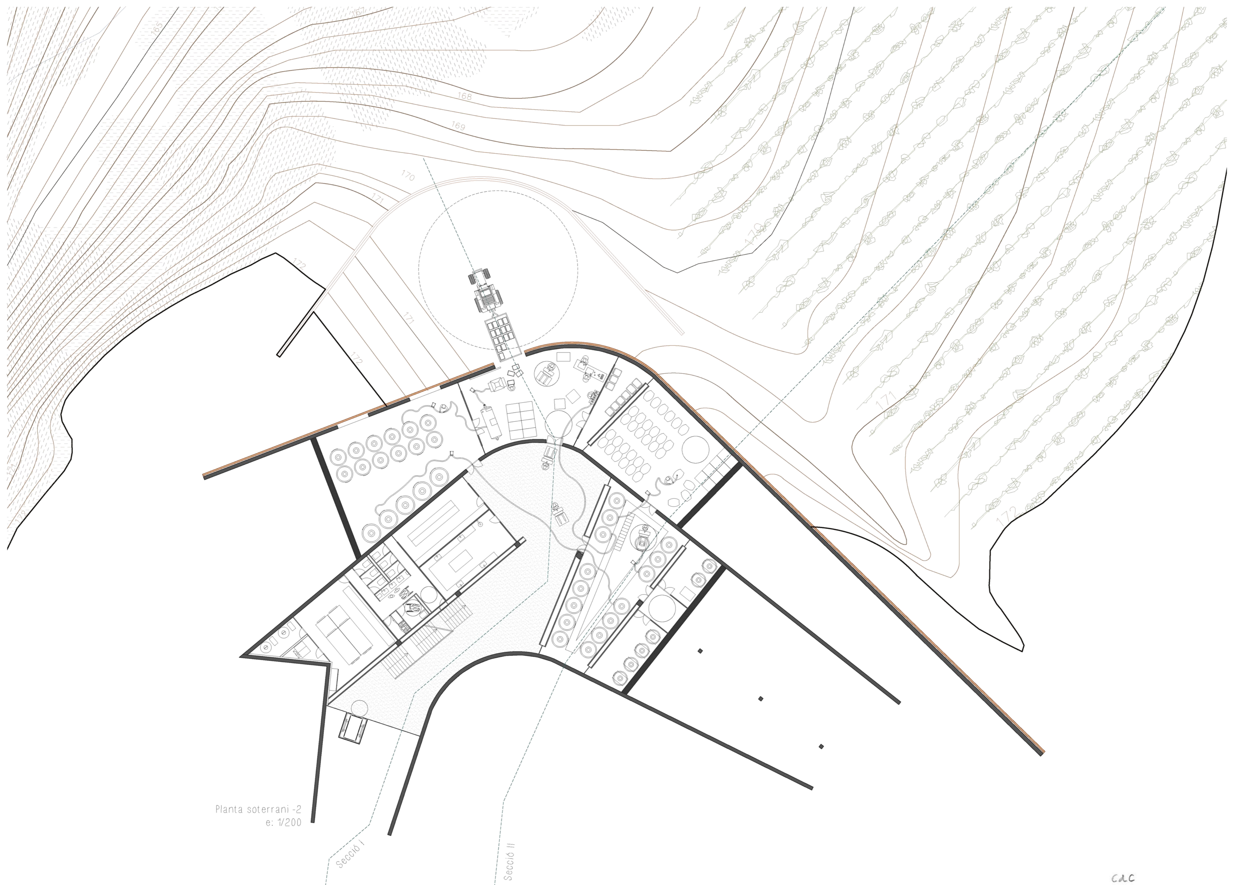
Planta soterrani -2 e: 1/200