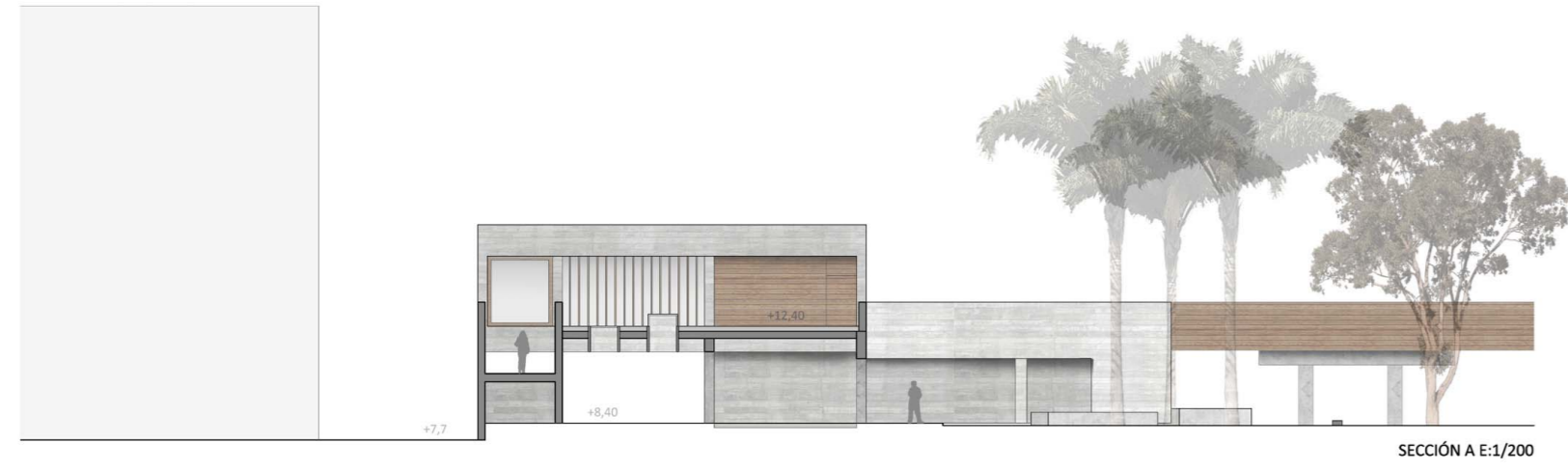
SECCIÓN A E:1/200