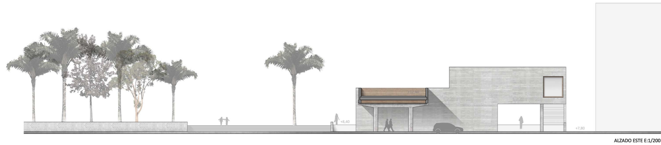
ALZADO ESTE E:1/200