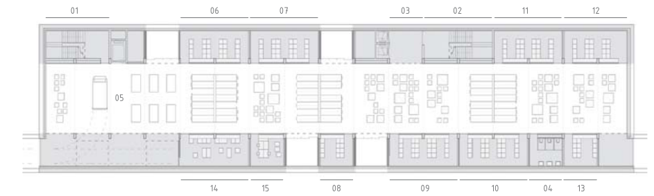
PLANTA SOTERRANI E. 1/100