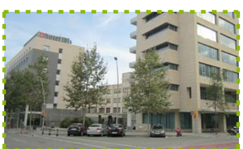
Exemple de cantonada on, tot i disposar d'una entrada a l'interior d'illa, els edificis no vinculen cap accés, us ni activitat amb aquesta.

En el cas del projecte es busca que l'edifici giri clarament cap a la cantonada i aquest s'obri clarament en aquest punt a la ciutat. L'edifici conté, a més, dos accessos als espais verds de l'interior de l'illa, un d'ells vinculats clarament a aquest espai. També es potencia la cantonada mitjançant la situació de dos punts claus a l'equipament: l'accés al restaurant/cafeteria i la terrassa d'aquesta, i l'accés a l'edifici del mòdul d'habitacions. Altres elements, com l'arbrat, emfatitzen la seva forma i característiques. Aquesta vinculació entre activitat de l'edifici i formalització de la cantonada vol aportar vida a un punt clau en la configuració de la trama.