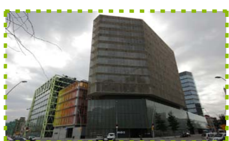
Exemple de cantonada on l'edifici té en compte la cantonada i aquesta condiona la forma. I to s'hi situa l'accés.