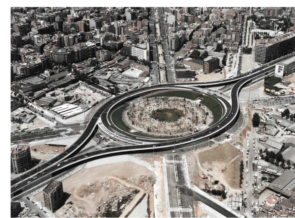
Estado de Glòries después de la edificación del anillo y el parque central.

En los años 1960-62, con motivo de los Juegos Olímpicos, se propuso la mejora de la red viaria construyendo unos viaductos que facilitaban las conexiones de la ciudad con el exterior. Consistía en un anillo elevado, el "tambor", que albergaba un gran espacio libre en su interior destinado a ser un parque en honor a los momentos gloriosos de la Historia de Cataluña.