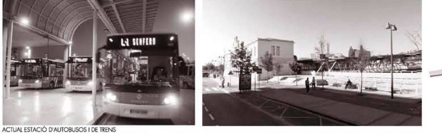
ACIUAL ESTACIÓ D'AUTOBUSOS I DE TREM

L'ubicació El projecte s'ubica just en la frontera entre el Casc Antic de Vic i el nou creixement urbà. És el punt d'unió entre la ciutat i el nou creixement urbà, on es troben els grans blocs i cases al·ludides. Les vies del Tren Les vies del Tren són una ciutat urbana per a la ciutat. A partir del soterrament d'aquestes la zona oest de Vic ha deixat de ser una zona perifèrica de la ciutat. Però en el punt en que es troben, molt ben comunicat ja que està al costat de la Plaça Major, del Carrer Verdader, de l'Estació de Tren, les vies tenen a quedar vistes i creen un CANVI DE COTA important entre les dues bandes d'edificis. La Proposta urbana La proposta urbana del projecte és primordialment UNIR LES DUES COTES que les vies del tren generen a la ciutat. Utilitzar la PLACA DEL MIL·LENNARI com a punt estratègic de canvi de sentit dels AUTOBUSOS, tota activitat per aquest punt. Crear un edifici urbà i fer-lo connectar amb l'entorn i fer un habitatge i un habitatge sobre les vies del tren mitjançant LES COBERTES igual com ho fa l'Estació de Tren.