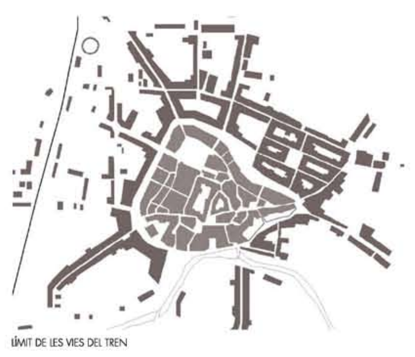
MAPA DE LES VES DEL TREM