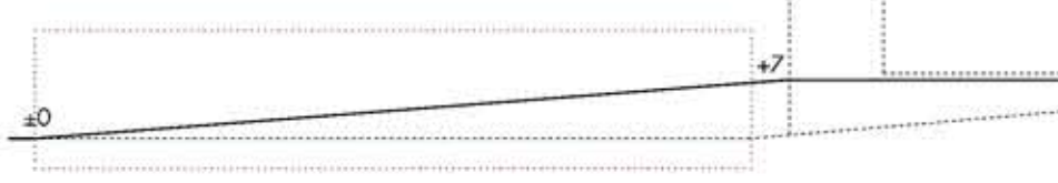
SECCIÓ ENTRADEIRA DEL LLOC: LA TOPOGRAFIA