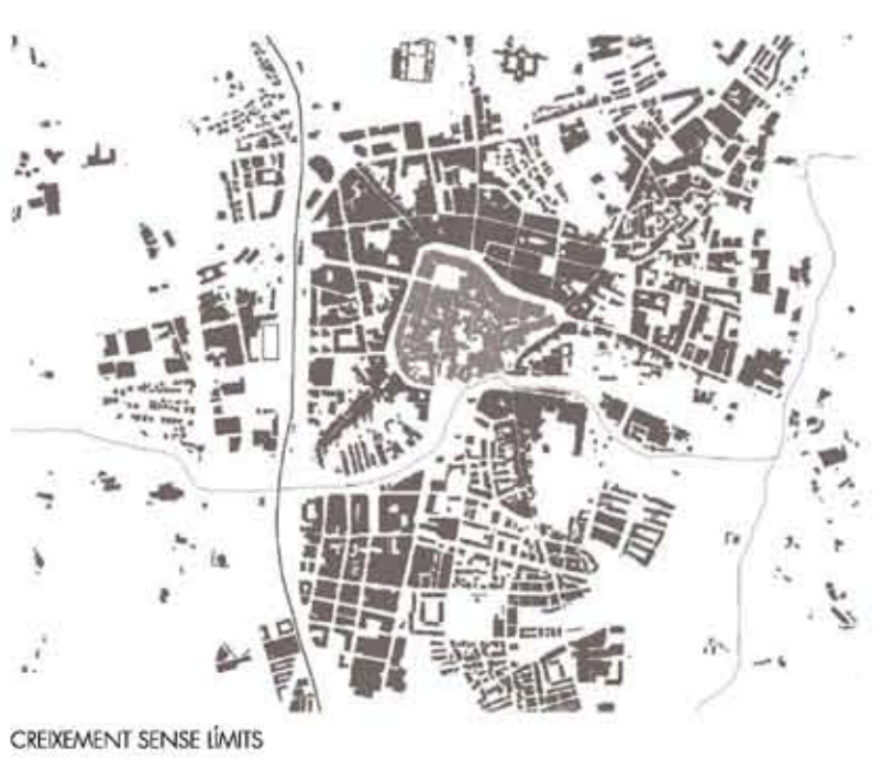
CREIXEMENT SENSE VALLS