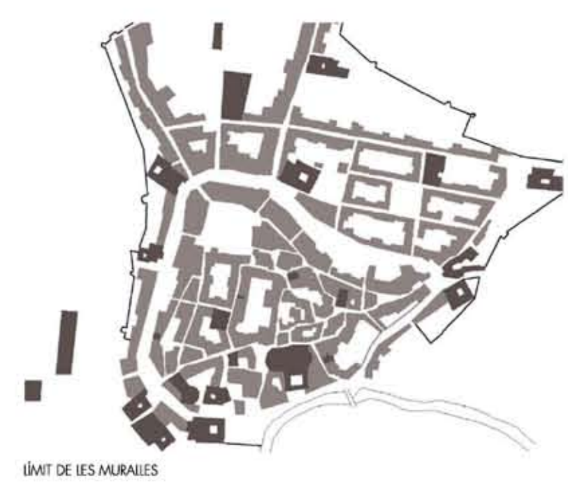
MAPA DE LES MURALLS

La ciutat Vic és la capital de la comarca d'Osona, al centre nord de Catalunya. La seva situació geogràfica, a només 69 km de Barcelona i 60 km de Girona, n'ha fet una de les capitals de la Catalunya central. És una ciutat de 40.000 habitants i amb una extensió de 30km 2 . La seva llegenda històrica, present als carrers i a les places del centre històric, conviu en harmonia amb el nou creixement urbanístic, que marca el dinamisme d'una ciutat contemporània, expressat a través del munt de les seves fires i mercats, de la construcció de la Universitat de Vic i del creixement dels polígons industrials. Vic és una ciutat rica en contrastes on conviuen la tradició i la modernitat. l'històric del món rural i els cançons més actuals, la tranquil·litat propera d'una ciutat petita i l'opinió i l'actitud i l'actitud. La riquesa del seu patrimoni, manifesta en la qualitat dels seus museus, onils i edificis històrics. l'estructura econòmica es basa en el sector comercial, industrial i de serveis.