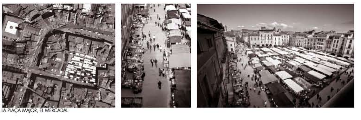
LA PLACA MAJOR, EL MERCAT

Vic és coneguda com la Ciutat de Fires i Mercats. La tradició del Mercat setmanal de la ciutat de Vic, ha fet que sigui una de les principals imatges de la ciutat. Al llarg dels anys, Vic ha anat creixent en més activitat de Mercats, com ara en aquest moment amb tres mercats setmanals, i dos mercats més que es celebren un cop al mes. El Mercadal, o Plaça Major, és un dels espais més característics i idèntics de la ciutat. És aquí on cada dimarts i dissabte té lloc el mercat setmanal. Aquest motiu empíricament ha aconseguit el mercat des del segle XIX, molt abans que es comencessin a construir les primeres cases que dibuixen l'actual plaça. El Mercat Municipal de Vic ha tingut molta importància des dels seus inicis ja que els productes de la zona són objectes molt apreciats i és el mercat on hi troben els productes alimentaris de proximitat.