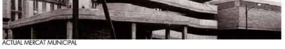
LA PLACA MAJOR, EL MERCAT