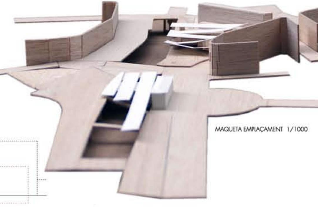
MAQUETA D'EMPAQUEM 1/1000