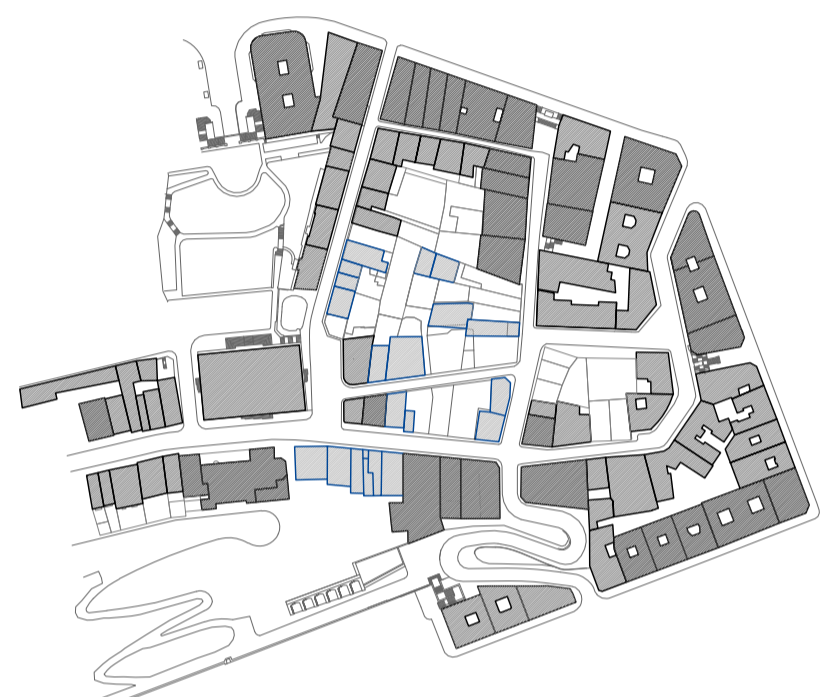
EDIFICACION EXISTENTE ■ EDIFICIOS CATALOGADOS ■ EDIFICIOS A DEMOLER