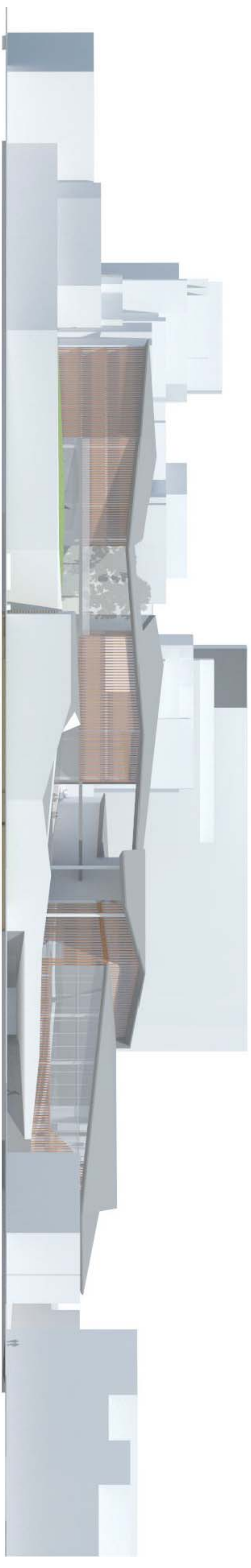
ALÇAT DE FAÇANA LATERAL A2