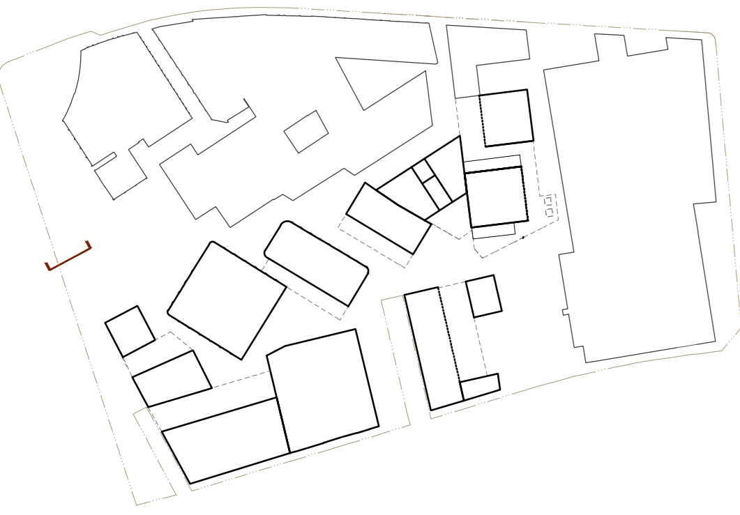
Secció Jardins Recuperats Parc Sagrera