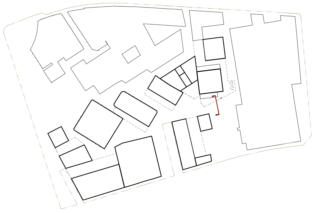
Secció Fragment Jardins Recuperats Escola de Cine