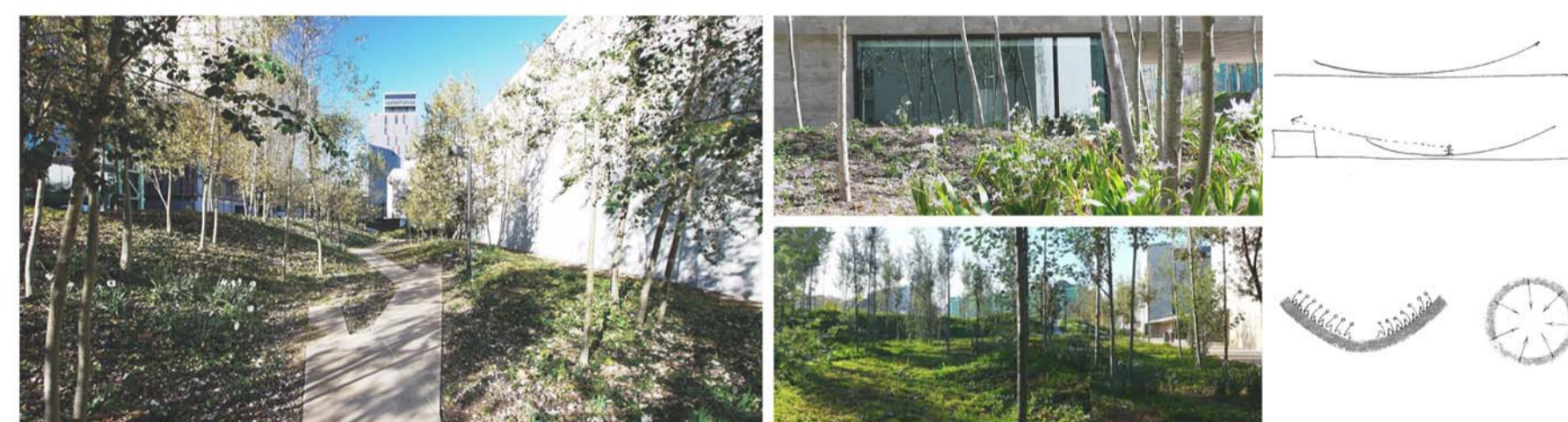
Fundació Vila Casas, Barcelona arquitectura Jordi Badia paisatgisme Martí Franch