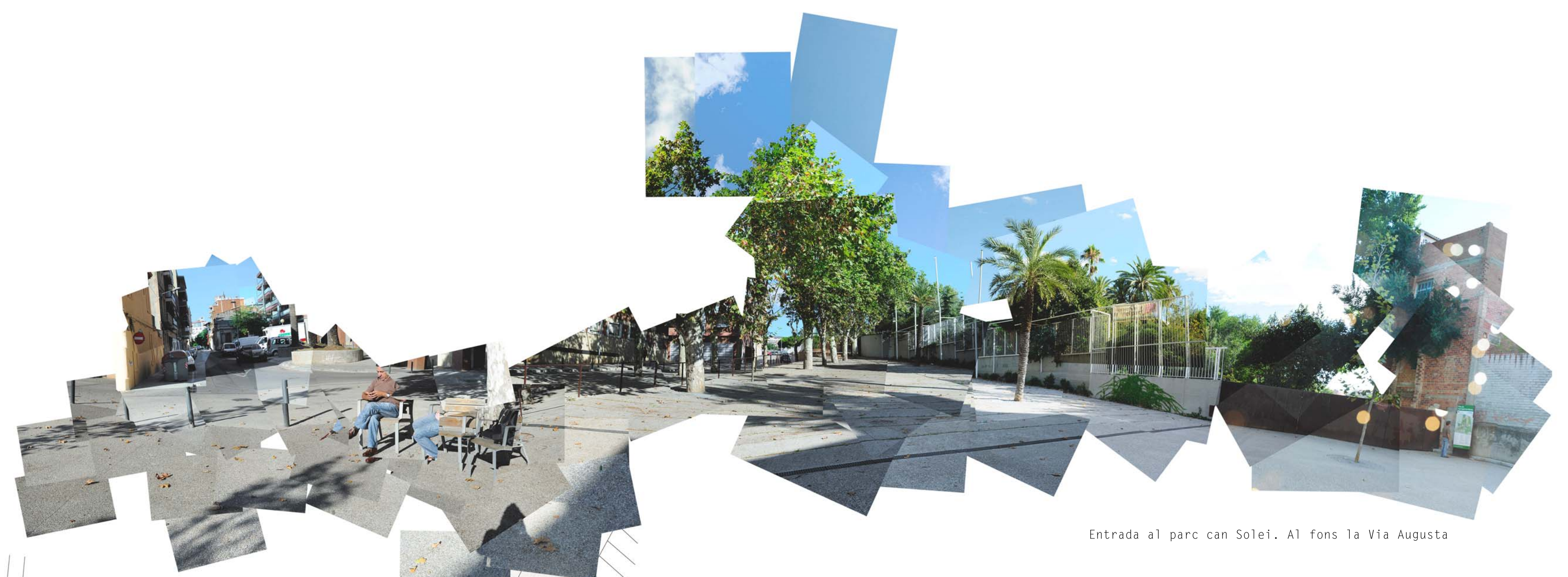
Entrada al parc can Solel. Al fons la Via Augusta