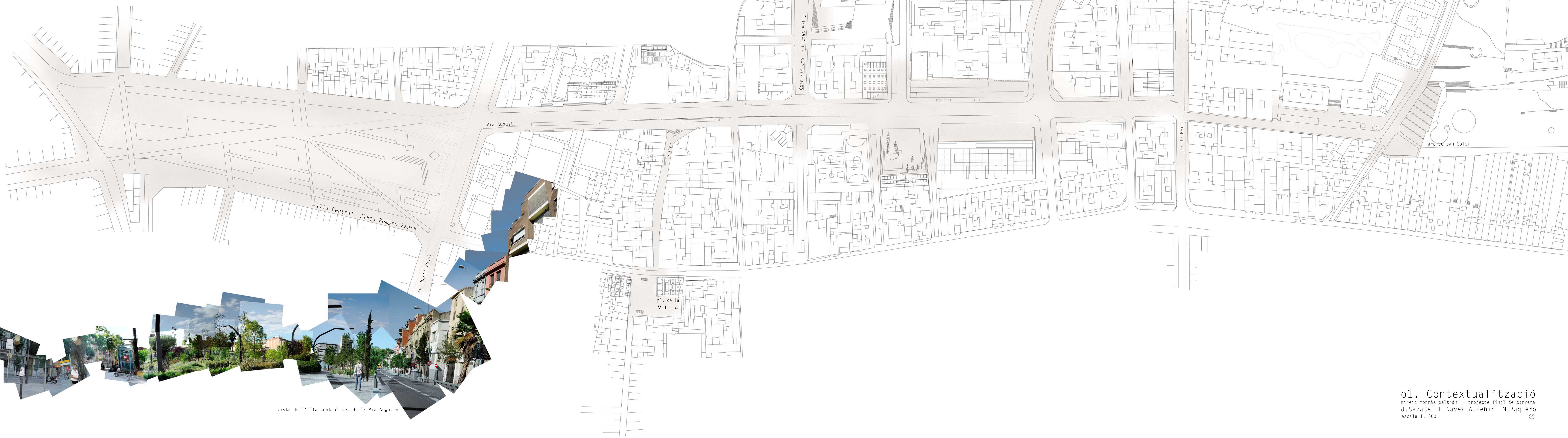
Vista de l'illa central des de la Via Augusta