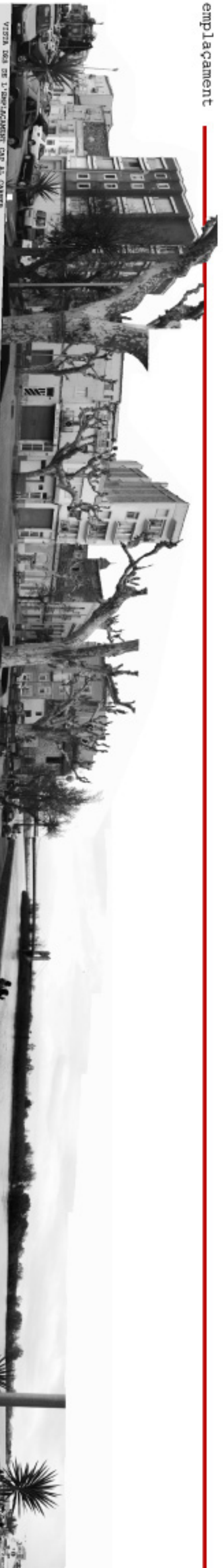
VISTA DES DE L'EMPLAÇAMENT CAP AL CARRER