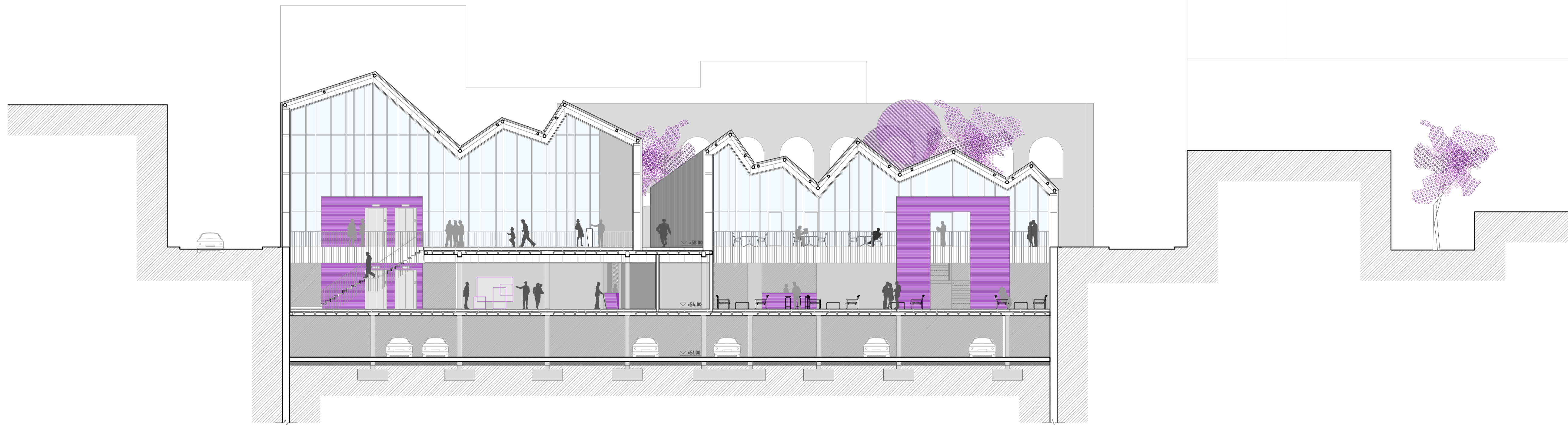
S2_ SECCIÓ TRANSVERSAL TALLANT PEL VOLUM DE L'ACCÉS-EXPOSICIÓ I EL BAR