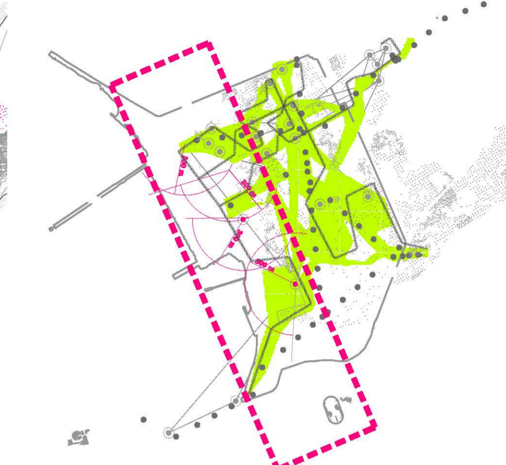
*La costa com a franja catalitzadora_Dispositius