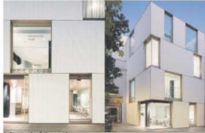
Hotel Alenti Carlos Ferrater