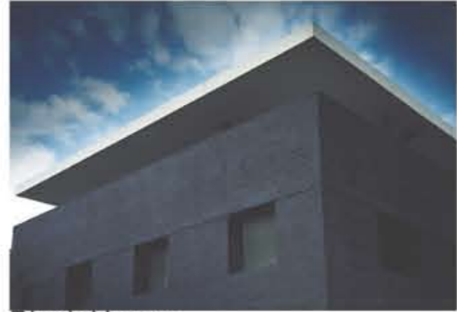
Black House David Adjaye