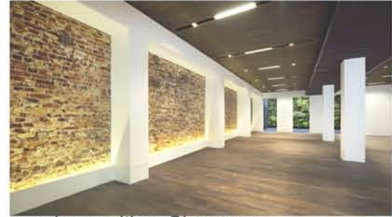
espai expositiu a Singapur KOBAK Office