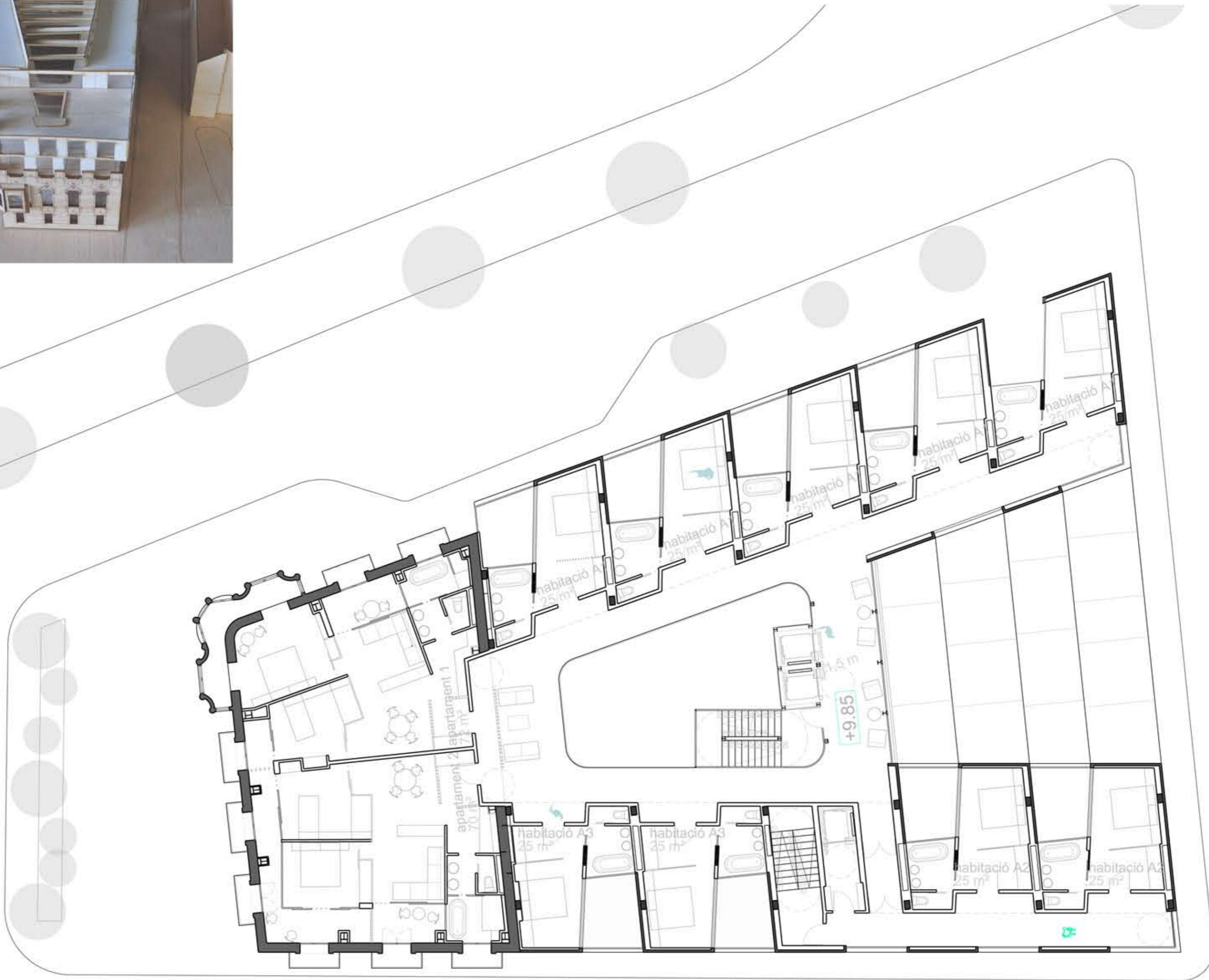
planta primera 1:150