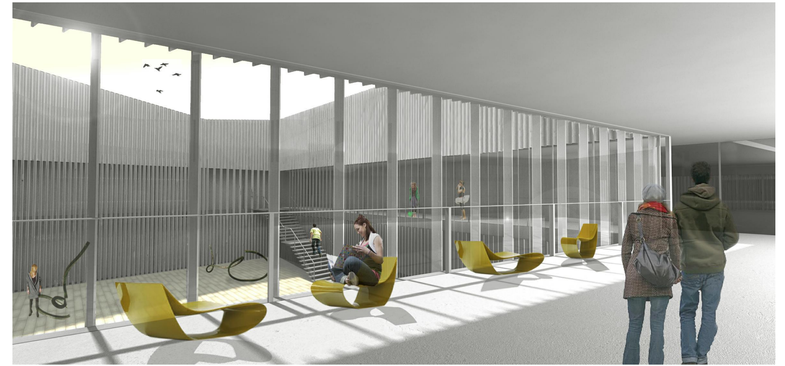
Vista des de la terrassa al pati de l'exposició