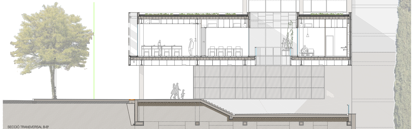
SECCIÓ TRANSVERSAL B-B'