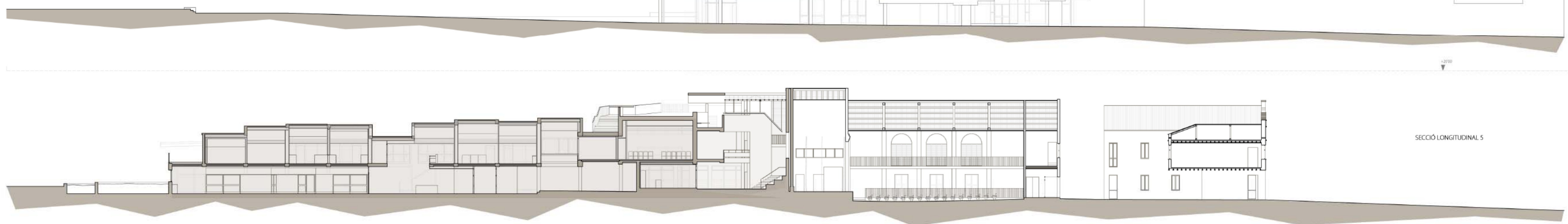
SECCIÓ LONGITUDINAL 5