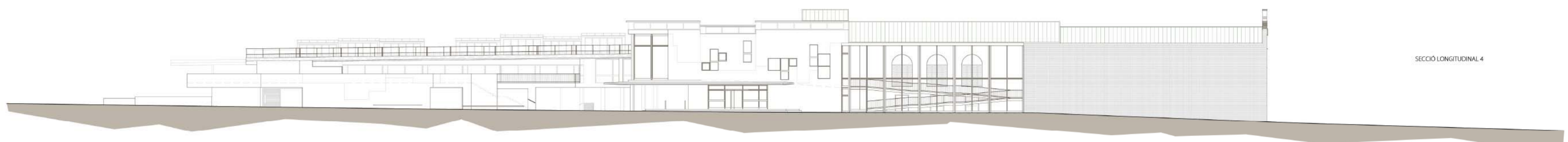
SECCIÓ LONGITUDINAL 4