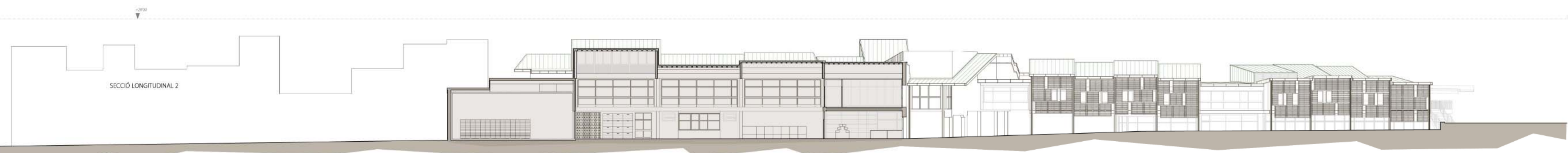
SECCIÓ LONGITUDINAL 2