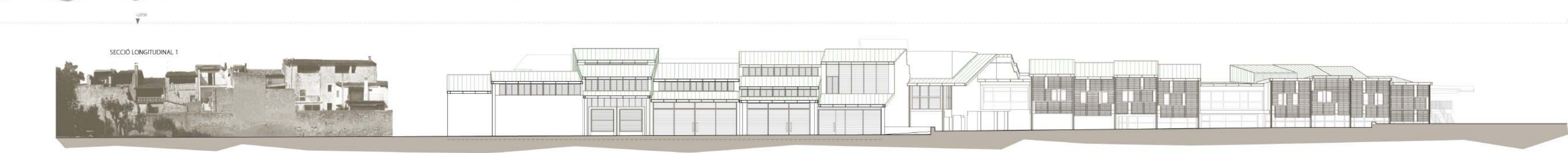
SECCIÓ LONGITUDINAL 1