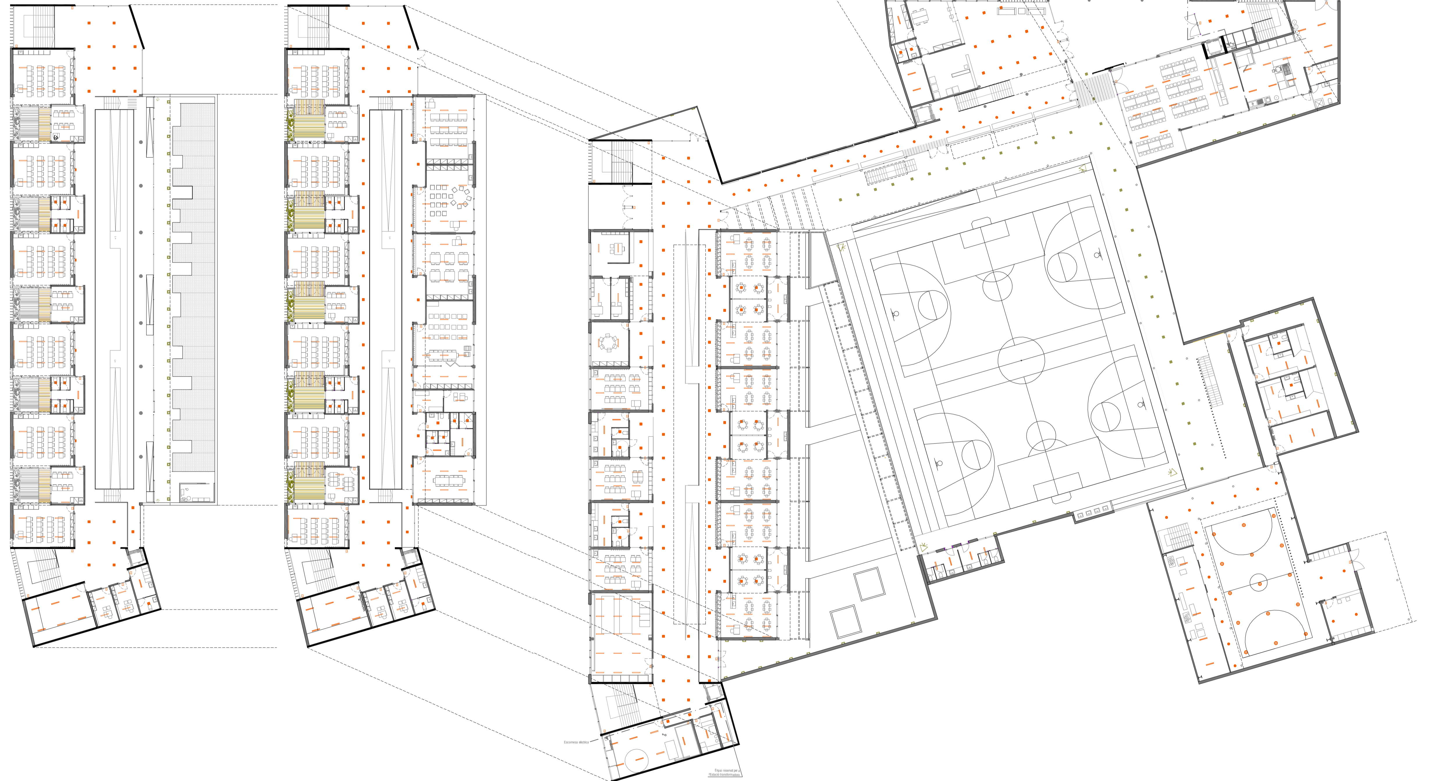
Planta segona Aules primària