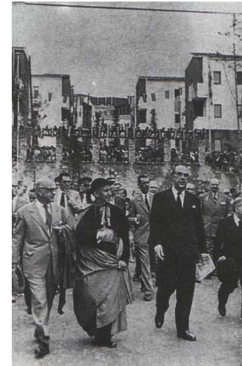
Figura 1.9 Visita de les autoritats, l'any 1951, a Las casas del gobernador a la barriada de Verdum. 37

També el Govern civil amb una actuació ocasional com a organisme promotor va construir el 1951-1952 un polígon de 906 habitatges anomenat Las casas del gobernador a la barriada de Verdum. Són de caràcter provisional, per allotjar famílies que procedeixen de les barraques, funció que compartiran molts grups d'habitatges i polígons d'aquesta època. Aquest fet explicarà també la construcció d'habitatges de reduïdes dimensions i de baixa qualitat de materials.