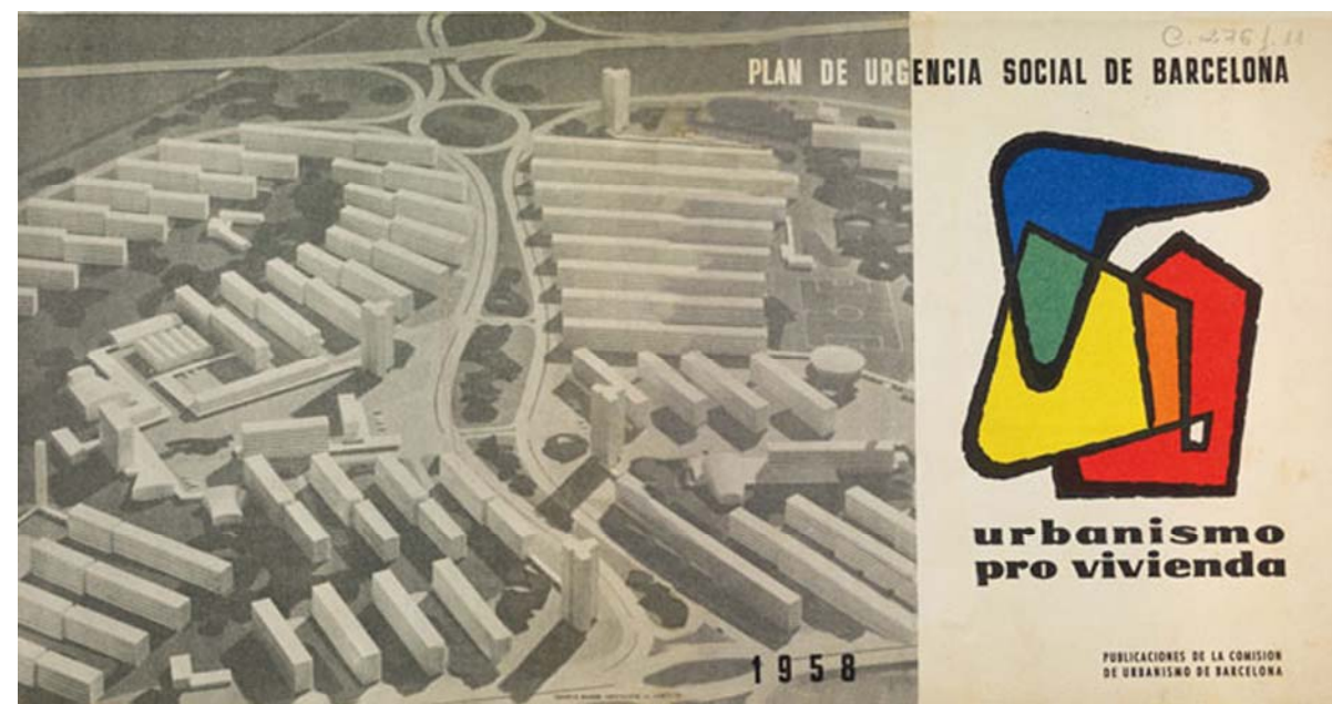
Figura 1.11. Portada de la publicació feta per la Comisión de Urbanismo de Barcelona al 1958, en motiu del Plan de Urgencia Social de Barcelona . 42

La llei va ésser promulgada primer a Madrid al 1957 i posteriorment va ésser aplicada en la seva totalitat a Barcelona al 1958 i seguidament a Biscaia i a Astúries al mateix any.