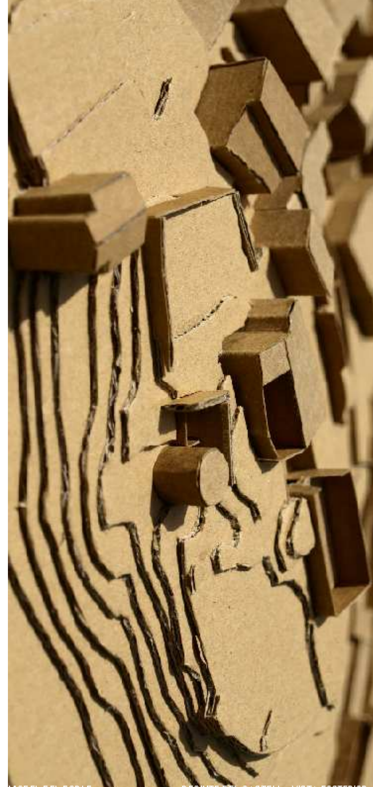
MODEL DEL FORTE RECENTI DEL CASTELL - VISTA POSTERIOR