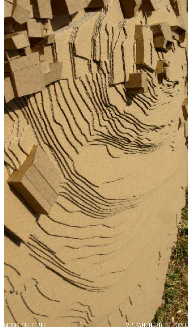
MODEL DEL FORTE VESSANT L'EGRO DEL FORTE