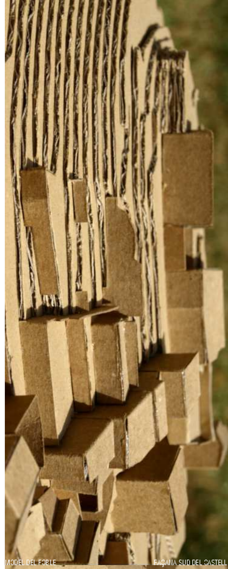
MODEL DEL FORTE BARRINA SUD DEL CASTELL