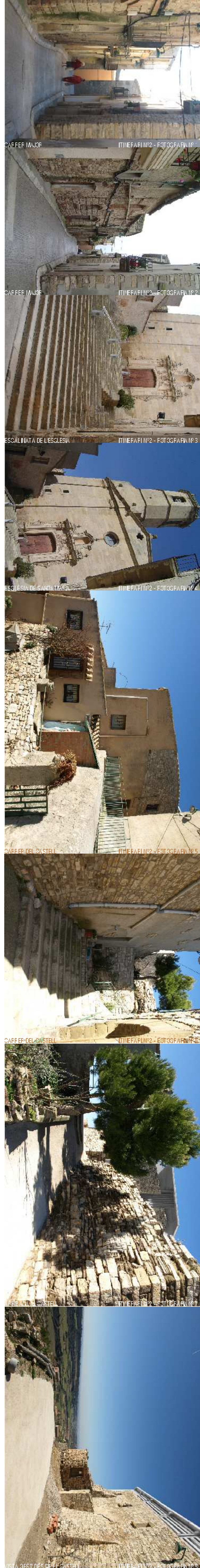
GRANYENA DE SEGARRA