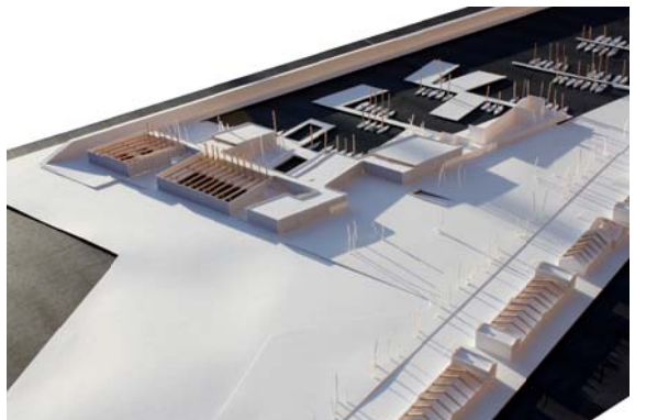
final passeig marítim