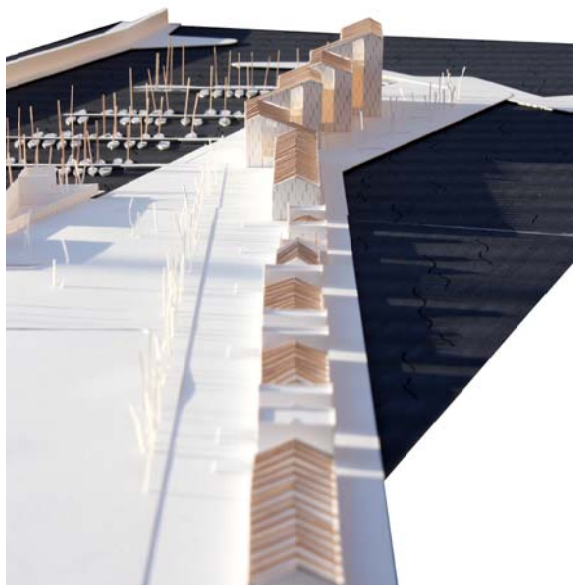
vista de les cobertes dels tinglados