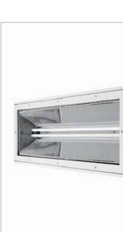
Lluminària HI-LUX IP44

Aplic de paret, basculant 30º. Amb reflector asimètric d'alumini. El situarem a la façana de la nau per a dotar-la d'illuminació per la nit.