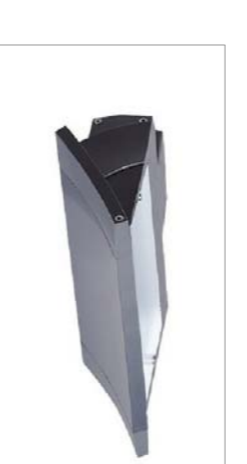
Aplic FINELAMP per llums halògenes lineals

Fabricat en extrusió d'alumini i lacerat en color gris. El farem servir en els box de treball i suspès a diferents alçades a l'interior de la planta que abraça la nau, donant així un aspecte industrial als espais.