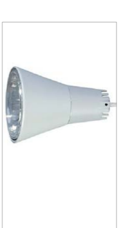
Lluminària TWIN per a suspendre PAREO

Es tracta d'un model amb barres paral·leles que permeten la suspensió, electrificació i continuïtat de les lluminàries. El situarem longitudinalment a les zones de taller i laboratoris.