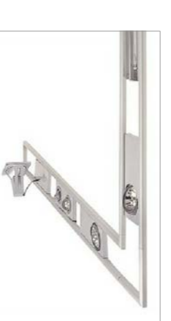
Lluminària MINI DUELAMP

Aquest model equipat amb regulació de color, conté un controlador a colors (vermell, verd i blau) i permet canviar a 13 graus d'exposicions i multifuncional de planta baixa.