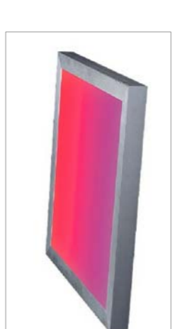
Lluminària DYNAMIC SHOW amb regulació de color

Aquest model equipat amb regulació de color, conté un controlador a colors (vermell, verd i blau) i permet canviar a 13 graus d'exposicions i multifuncional de planta baixa.