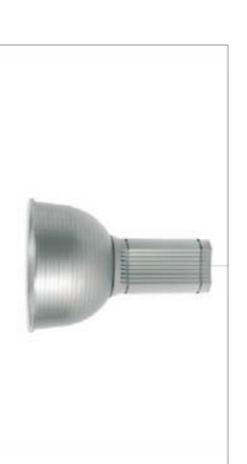
Downlight suspès MINIVES

Aquest model fabricat en alumini de injecció i pintat de color gris, el farem servir a les zones d'administració i zones de consulta. Situarem els elements suspesos del sostre.