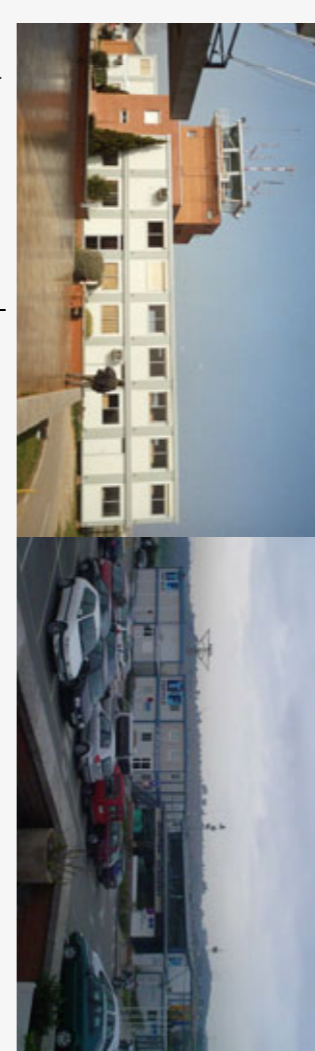
LES ESCOLES HAN D'INHIBIR LES SEVES CLASSES EN S'ABASTAÇIÓ PREPARACIONS

A MÉS DE LES INTERVENCIIONS JA REALITZADES FINS AVUI DIA, EL PLA PREVEU LA CONSTRUCCIÓ DEL MUSEU DE L'AIRE DE SABADELL (JA ESMENAT ANTERIORMENT) I PROPORCIONA UNA RESERVA D'ESPAI PER A EDIFICAR NOVES INSTAL·LACIONS PER A LES ESCOLES DE VOL, QUE ACTUALMENT SÓN PRECÀRIES.