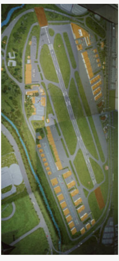
MAQUETA DEL PLA DIRECTOR

LA REFORMA I AMPLIACIÓ QUE S'ESTÀ DUENT A TERME A L'AEROPORT DE SABADELL ESTAN REGULADES PER EL PLA DIRECTOR QUE ES VEU EN EL PLÀNOL. AQUEST DESENVOLUPAMENT DE L'AEROPORT NO ES DEU SOLAMENT A LA NECESITAT DE MILLORAR LES INSTAL·LACIONS EXISTENTS SINÓ TAMÉ A LA VOLUNTAT DE POTENCIAR L'AVIACIÓ GENERAL DE LA PROVÍNCIA DE BARCELONA I EL SEU ENTORN, DONAT QUE L'AEROPORT DEL PRAT NO DISPOSA D'INSTAL·LACIONS DESTINADES ESPECÍFICAMENT A AQUEST TIPUS DE TRÀNSIT AERI.