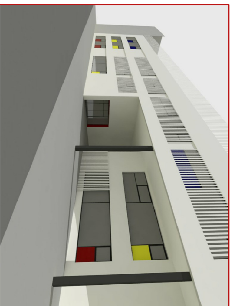
Vista de l'accés amb la porta d'accés a l'interior oberta

La porta oberta se situaria per davant de la façana de la biblioteca, formant part d'ella, enfocant així l'entrada a aquesta i donant-li un aspecte diferent que a la resta d'equipament.