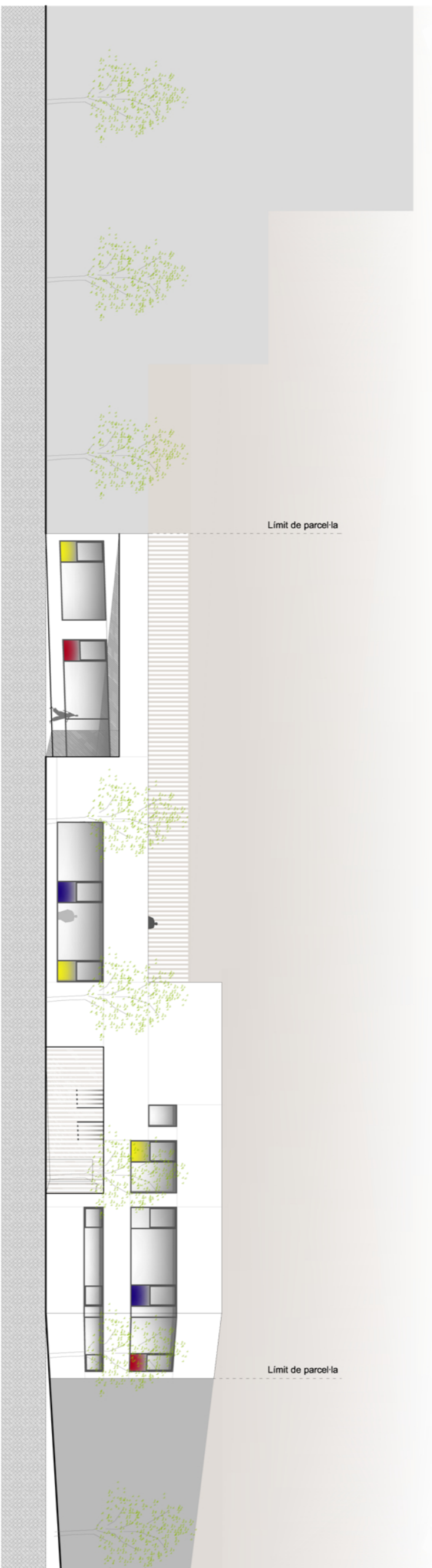
Secció C. Alçat accés a Educació Infantil Alçat Carrer d'Almogàvers