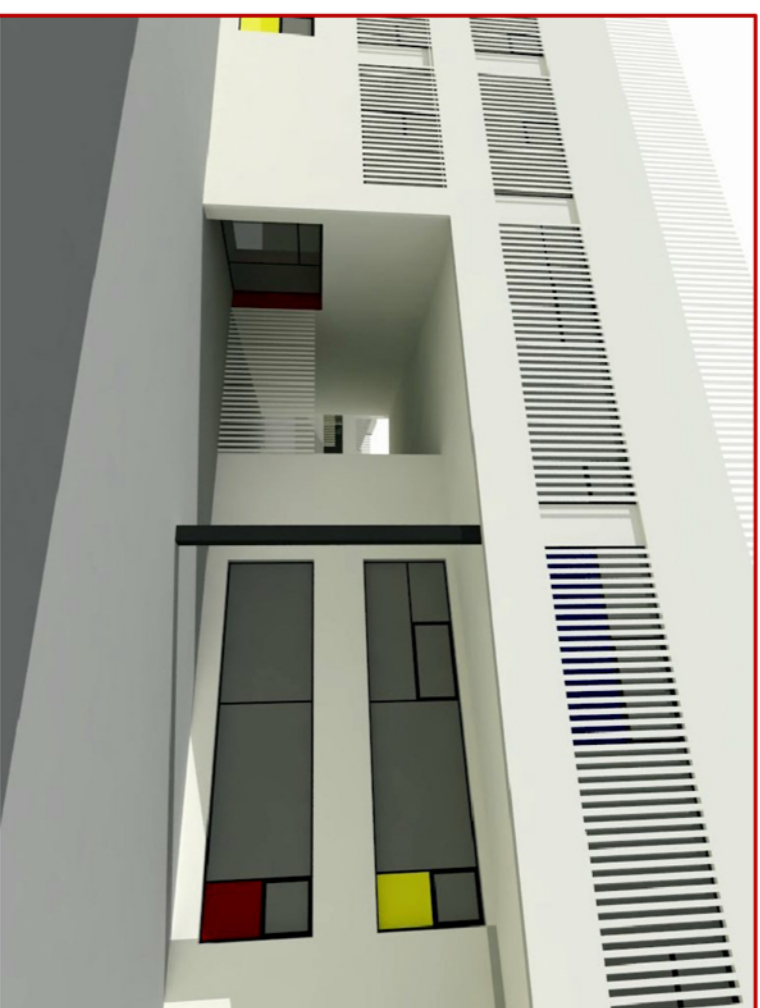
Vista de l'accés amb la porta d'accés a l'interior del recinte l'ancada

L'accés dels alumnes d' Educació Primària es dona des del Carrer de Buenaventura Muñoz. Aquesta es fa a través d'un gran porxo que dobla alçada suportat per dos pilars metàl·lics, buscant la mínima expressió d'arquitectura. Aquest accés comunica directament amb la zona exterior de l'àrea de Primària i és l'accés també a la biblioteca. És per això, que aquesta accés compta amb una reixa, seguint la mateixa composició de remat superior de façana, d'elements metàl·lics verticals de color blanc, per poder rematar el remat del CEIP durant l'horari lectiu i fora d'horari d'obertura del gimnàs i biblioteca.