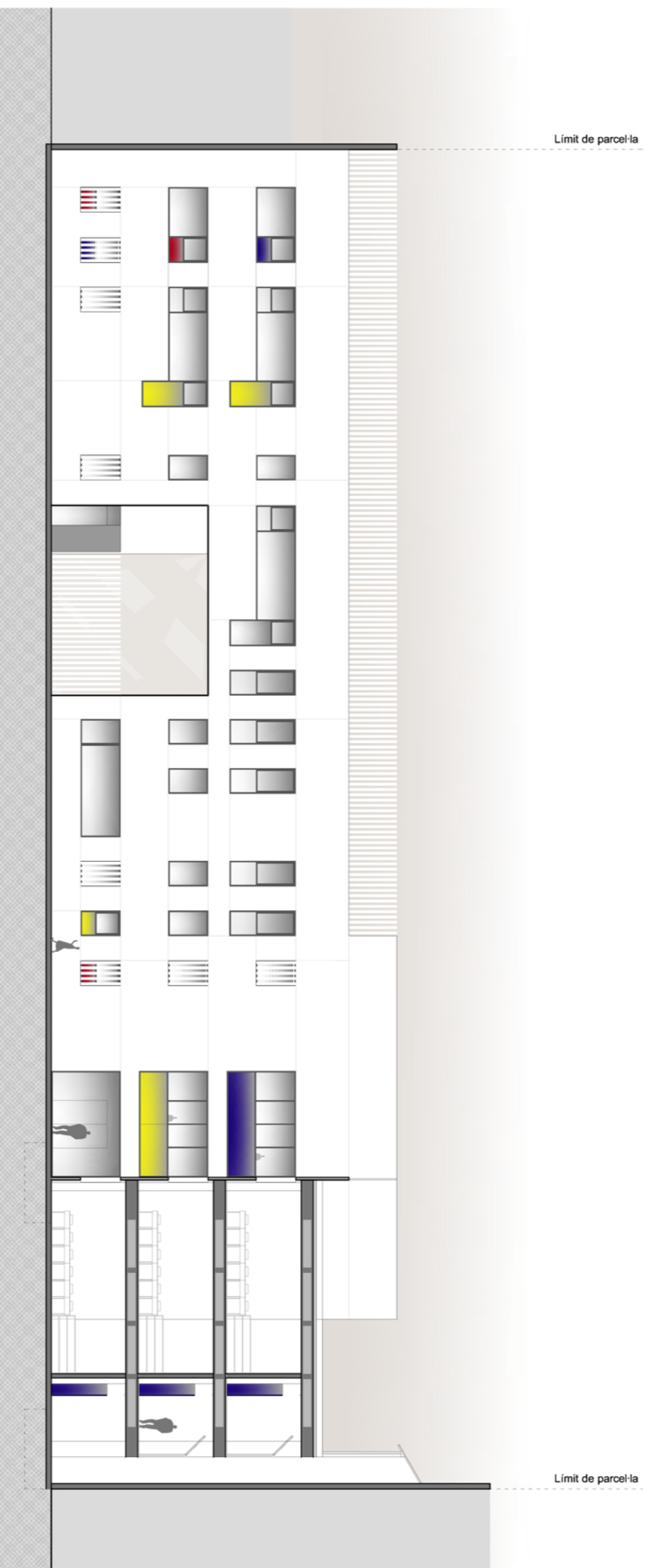
Secció B. Alçat posterior accés a Educació Primària