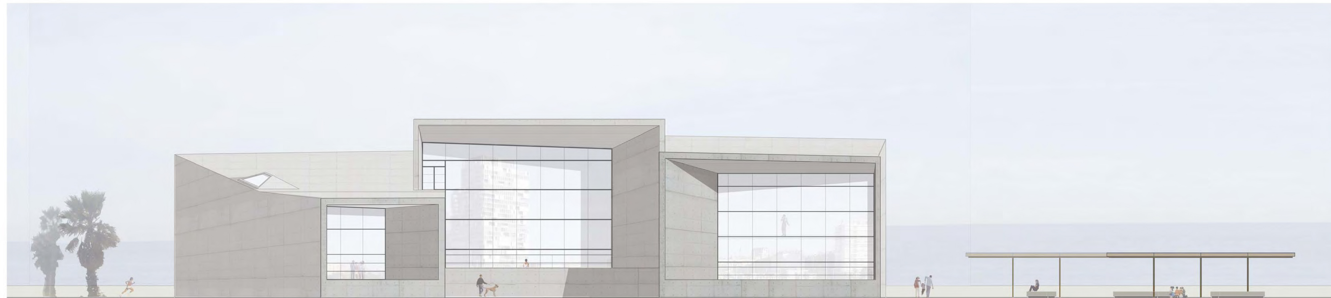
ALÇAT NORD OEST_E: 1/200

La volumetria de l'edifici intenta imitar les formes de l'escollera, convertint-se en una prolongació d'aquesta. La façana es divideix en tres grans cubs perforats tancats amb una façana ventilada que permet mantenir les visuals de banda a banda de l'edifici. La coberta es tracta com una façana més, ja que els edificis propers ténen una alçada molt superior, per tan la coberta del centre es percep des de quasi totes les edificacions colindants. El material triat és el formigó vist, ja que és el material amb el que està fet l'escollera i també permet donar una continuïtat façana-coberta, tenint en compte la morfologia de l'edifici.